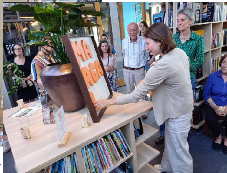
Feestelijke opening van de winkel door de wethouder