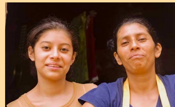
Vrouwen die zaken doen dankzij microkrediet

Microkredietorganisatie Fumdec werkt met leningen van het kredietfonds van het Landelijk Beraad Stedenbanden. Daarnaast ontvingen ze van ons 4.000 dollar voor aanvullende trainingen voor de vrouwen.