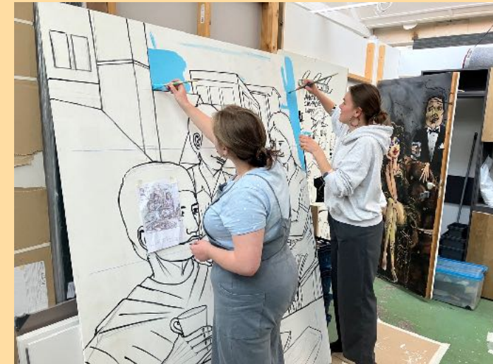
Twee studenten schilderen in Falcon gebouw