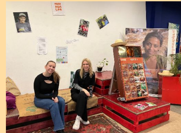
Trainees bij expositie

Met de activiteiten van de Milieudefensie trainees bereikten we 250 mensen op markten en in de winkel, 30 mensen via de expositie. Daarnaast exposure via drukwerk en de socials, ook de socials van de Nachtzuster.