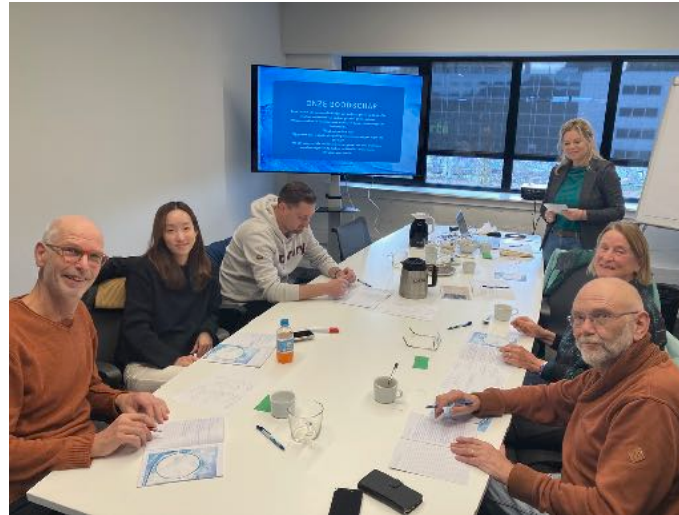
De perspectiefgroep bij een workshop

We merken dat jonge vrijwilligers en studenten ons goed weten te vinden via de vrijwilligersbank en andere kanalen. Dat stemt hoopvol!