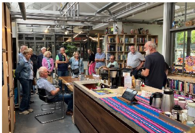
Stadsgids met bezoekers in de winkel

Met grote verwachtingen en veel plezier openden we in april onze fysieke winkel aan de Piushaven. Hier bereikten we dit jaar nieuwe klanten voor de koffie én