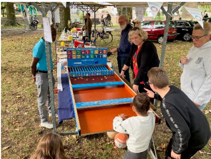
Global Goals sjoelen bij Mundial Noord