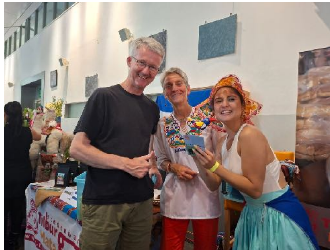
Bezoekers Sabores Litanos