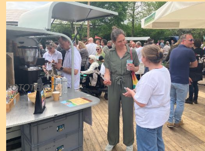
In gesprek met kaartjes