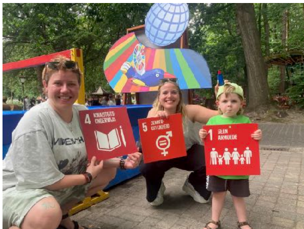
Familie met bordjes vogeltjesrace