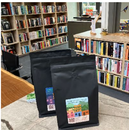
Koffie en boeken in onze winkel

andere werkwijze op de plantages. Tevens is een nieuw project ingediend waarvoor de fondswerving nog moet worden opgestart.