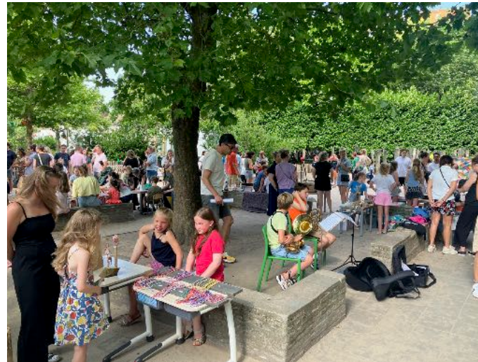
Feestavond Panta Rhei