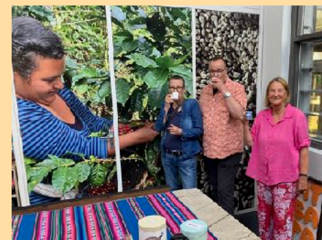
Klanten proeven koffie