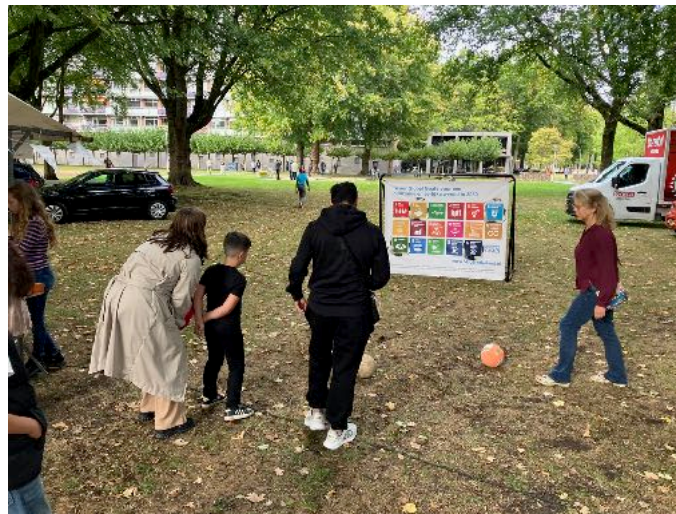
Global Goals doelschieten bij Mundial Noord