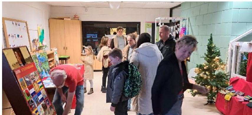
Kerstactie Petteflet 2025

Met basisschool Panta Rhei werkt de Stedenband al meer dan 30 jaar samen. Er wordt input geleverd voor de lessen wereldburgerschap in de projectperiode en er is de jaarlijkse sponsorloop en feestavond voor ouders en familie. Dan is de Stedenband ook aanwezig met een kraam. Sinds 2023 steunt de school met de opbrengst van de jaarlijkse sponsorloop meerdere goede doelen. Het onderwijs in Matagalpa is er daar een van. Nieuw in 2025 was de interesse van Montessorischool de