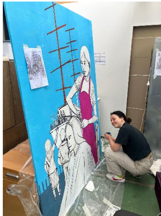
Student schildert in Falcon gebouw

In het nieuwe pand van de Stedenband zijn twee panelen geplaatst in de entreehal. Afgebeeld zijn de huurders in dat deel van het Falcon-gebouw. Vrijwilligers en studenten hielpen met schilderen mee. Alle muurschilderprojecten werden meegefinancierd door het LBSNN (de koepelorganisatie van gemeenten in Nederland die samenwerken met Nicaragua) en het Platforma-netwerk van de Europese Unie.