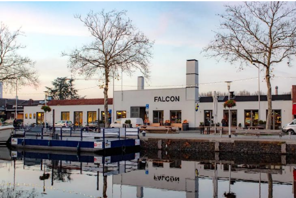
Het gebouw aan de Piushaven met onze winkel