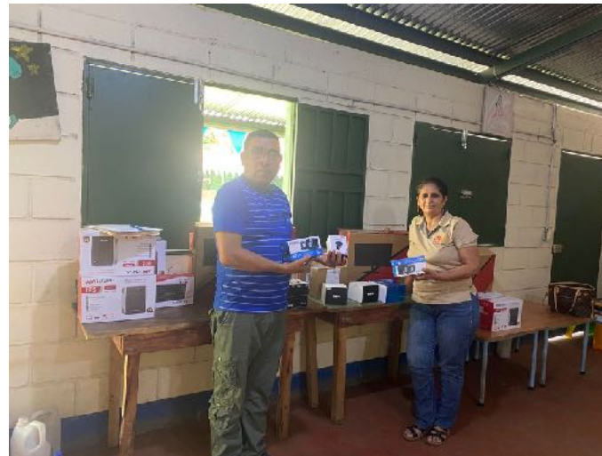
Materialen en computers voor rurale school Juan Luis Barni

beter onderwijs. Op de scholen Oasis en Wesleyano in de arme wijk Sor Maria Romero en op de school Juan Luis Barní in het dorp Samulalí is gewerkt aan infrastructurele verbeteringen, zijn materialen aangeschaft, meubilair en computers. Dit alles voor een totaalbedrag van ruim 17.000 dollar. Dank aan alle scholen, met name Panta Rhei, en donateurs voor het bijdragen aan de verbeteringen