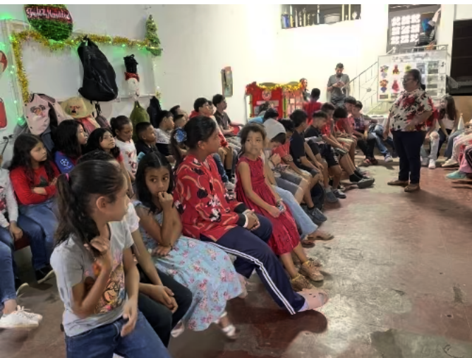
Kinderen bij de Hormiguitas