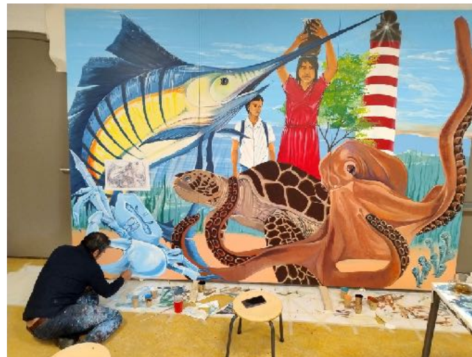
Mural basisschool Zuidwester