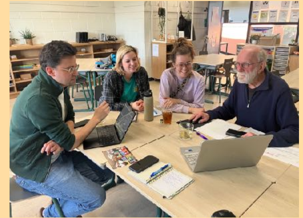
Docenten Petteflet met Frans

Petteflet, in de Reeshof. Na een presentatie van de Stedenband voor het team, werd besloten tot een samenwerking. Meerdere docenten zijn geïnteresseerd in deelname aan de onderwijsreis (2026). In de Kerstperiode stond de Kerstactie in het teken van Matagalpa en werd aan de leerlingen en hun ouders diverse (les)activiteiten aangeboden en stonden wij op de markt met koffie, vogeltjes en boeken.