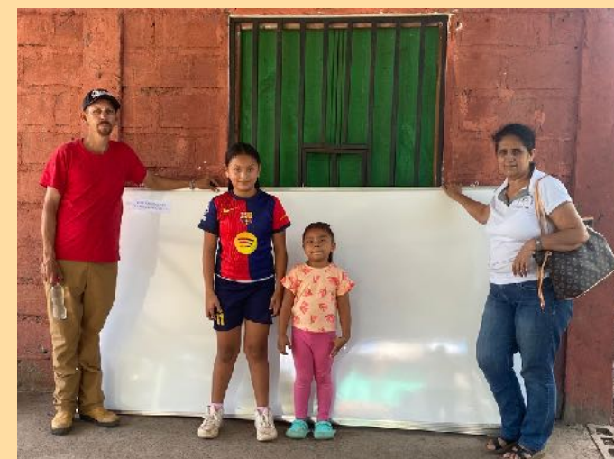
Whiteboard voor Oasis school

Onze partnerorganisatie Comité Mano Vuelta zit in een lastig parket. Ze bestaan nog steeds, en dat is al best bijzonder, maar ze kunnen niet meer samenwerken met openbare basisscholen. Het Ministerie van Onderwijs wil geen bemoeienis of bezoek op de scholen. Daarnaast wordt het ontvangen van fondsen en het uitvoeren van projecten steeds bureaucratischer, tijdrovender en duurder. Wat ons betreft is dit geen wenselijke situatie. Maar wat is het moeilijk voor het Comité (een zelfstandige vereniging) om het besluit te nemen om te stoppen als formele organisatie. Dat