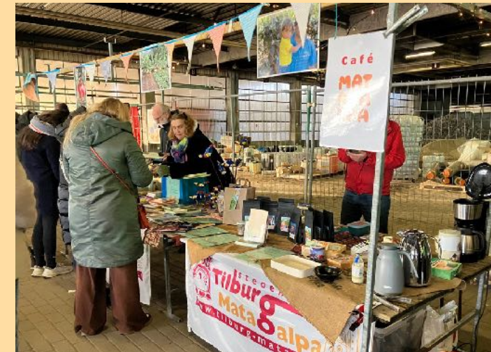
Kraam Funky Market