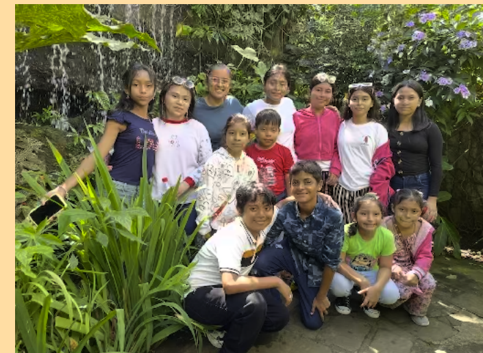
Een uitje voor de kinderen van de Hormiguitas

Ook steunden we opnieuw het centrum voor kansarme kinderen las Hormiguitas, momenteel functionerend onder de naam Construyendo Huellas. Ongeveer 60 kinderen krijgen ondersteuning bij hun schoolactiviteiten, ontspanning en psychologische hulp. Samen met een Zwitserse en Duitse organisatie zorgen we ervoor dat ze kunnen blijven functioneren.