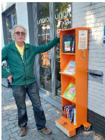
Kastje bij de winkel