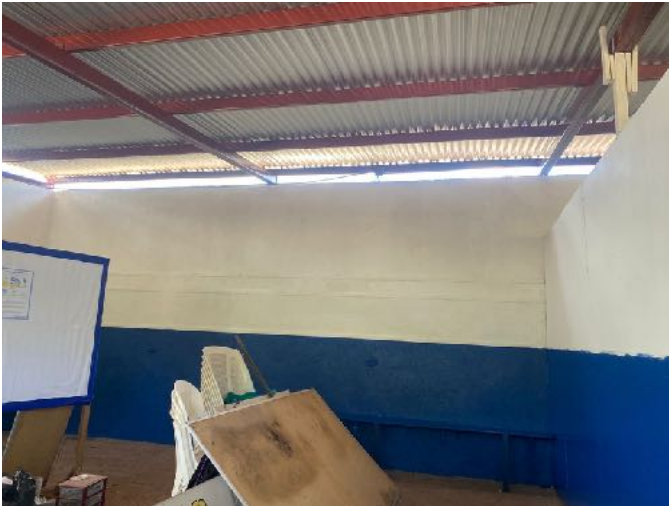
Nieuw dak voor lokaal Oasis school

Gelukkig is onze vriendschap sterk en blijven we in gesprek om te kijken wat wél kan. Dit jaar lukte het om de vorig jaar steeds uitgestelde onderwijsprojecten te realiseren. Op drie basisscholen die niet onder de verantwoordelijkheid van het ministerie vallen (maar zijn opgezet door kerken en particulieren) werd met Tilburgs geld gewerkt aan