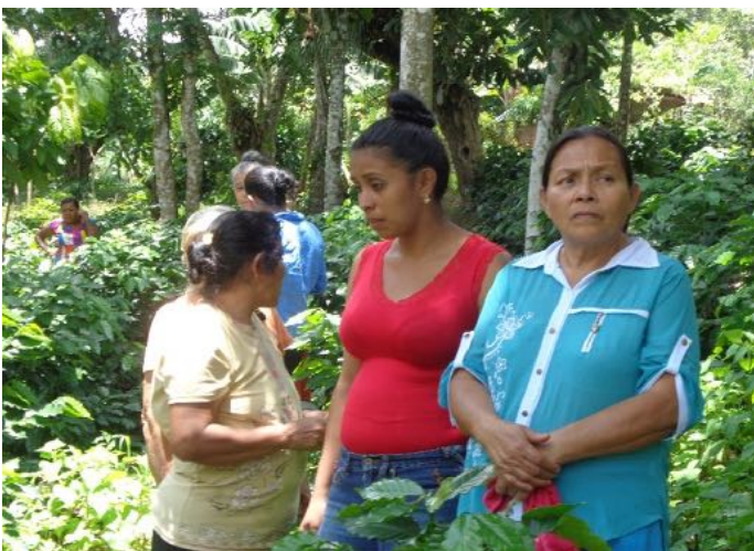
Koffieboerinnen op de plantage

De koffiecoöperatie UCA San Ramón heeft in 2025 een project ter waarde van 10.000 dollar uitgevoerd om vrouwelijke koffieboeren weerbaar te maken tegen de klimaatveranderingen met nieuwe aanplant en een