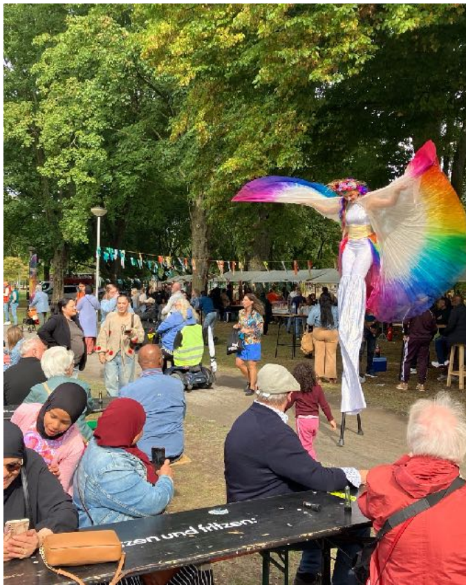
Bezoekers Mundial Noord

Bij het project op de Zuidwester bereikten we 200 leerlingen, 25 docenten en 400 ouders. In de entree van het Falcon-gebouw genieten dagelijks vele klanten die voor een van de ondernemers komen van de panelen.