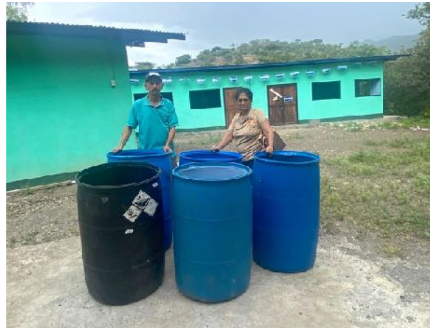
Watertonnen voor Wesleyano school