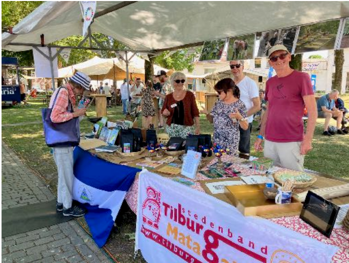
Kraam bij Havenfeest

van 2025 waren we present bij Sabores Latinos, het Havenfeest, Mundial Korvel, Zomersmaak in Groeituin013, de boekenmarkt Boeken rond het Paleis en Mundial Noord. Onze kraam bood een wisselend aanbod; soms stond de koffie centraal, soms de boeken, soms de Global Goals sjoelbak en het voetbaldoel.