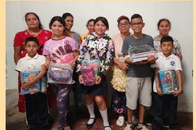
Kinderen uit arme families krijgen materialen

beter onderwijs. Op de scholen Oasis en Wesleyano in de arme wijk Sor Maria Romero en op de school Juan Luis Barní in het dorp Samulalí is gewerkt aan infrastructurele verbeteringen, zijn materialen aangeschaft, meubilair en computers. Dit alles voor een totaalbedrag van ruim 17.000 dollar. Dank aan alle scholen, met name Panta Rhei, en donateurs voor het bijdragen aan de verbeteringen