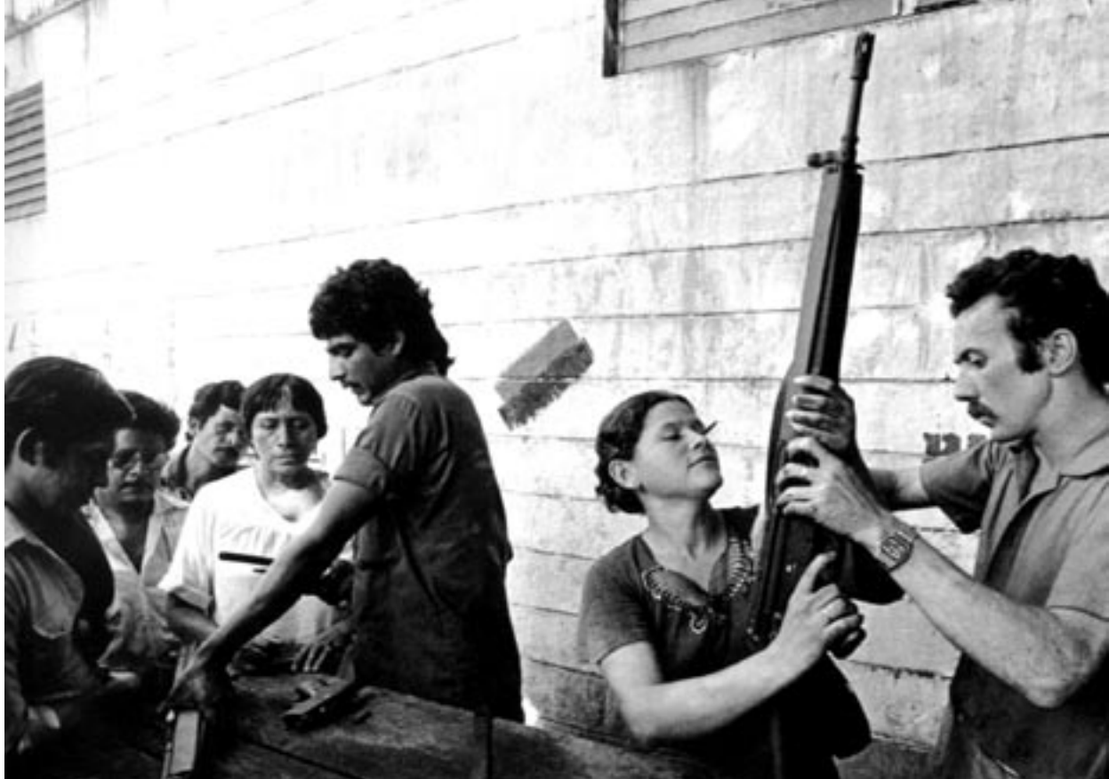
vrouwen en mannen samen in de strijd

In de jaren zestig begon het eerste verzet in de bergen in het noorden van Nicaragua. Tijden moesten veranderen. Er moest een tijd aanbreken waarin de Nicaraguanse bevolking het voor het zeggen had. Door deze veranderingen in de maatschappij richtten een aantal mensen het Sandinistisch bevrijdingsfront op (FSLN) 1 . 'Ik beleefde mijn tienerjaren in de jaren zestig,' vertelt Baéz mij. 'Ik wilde de wereld ontdekken, meepraten over de problemen in het land en mezelf ontwikkelen, maar kansen kreeg ik niet.'