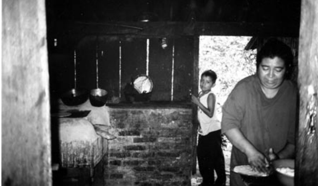
het kookgedeelte

hun hoofd en in principe een reguliere inkomstenbron voor hun werk op de plantage. Daarnaast zijn er ook duizenden loonarbeiders die met hun gezinnen van plantage naar plantage zwerven op zoek naar werk. Vaak komen zij in het hoogseizoen voor de koffiepluk naar de plantages en slapen dan in kampementen. Deze kampementen zijn kleine kamers waar soms dertig tot veertig personen in driedubbele bedden zonder matrassen boven elkaar slapen. Deze beelden deden mij veel denken aan beelden van de concentratiekampen uit de Tweede Wereldoorlog.