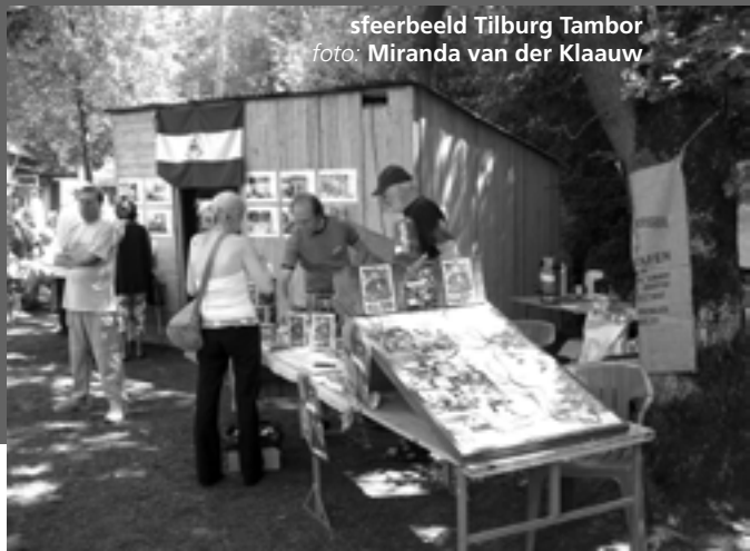
sfeerbeeld Tilburg Tambor

Hoewel het aantal bezoekers op deze negende editie van 'Boeken rond het paleis' wat tegenviel -ook enkele standhouders hadden zich bang laten maken door de weervoorspellers- wisten nog genoeg mensen onze kraam tegenover de bibliotheek te vinden. Bijna alle aangekondigde stortbuien bleven uit en het was uiteindelijk prachtig boekenweer. Dit jaar gingen we voor het eerst met minder boeken naar huis dan waar we mee gekomen waren. De opbrengst was dan net weer meer dan vorig jaar. Met 545 euro in kas -bestemd voor een milieuproject in Matagalpa- waren we dik tevreden. Iedereen die bijgedragen heeft, door mee te helpen of met boeken, willen we hartelijk danken.