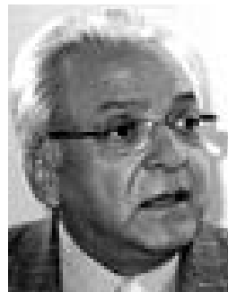
José Rivo; PLC