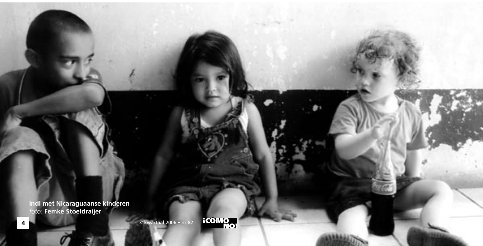
Indi met Nicaraguaanse kinderen

We hebben ook een bezoek gebracht aan de organisatie Fundación Entre Volcanes, we liepen toevallig voorbij hun kantoor. De mensen daar wilden ons wel gelijk te woord staan, toen wij met een nieuwsgierige blik naar binnen keken. Wat fijn, geen afspraken te hoeven maken! De directrice nam ons mee naar haar kantoor en vertelde heel veel en heel snel, waardoor ik helaas lang niet alles op heb kunnen pikken, maar het werd me wel duidelijk dat zij als organisatie zich inzetten voor het welzijn van de mensen op het eiland. Ze doen bijvoorbeeld aan voorlichting en het bespreekbaar maken van