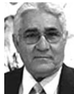
Edén Pastora