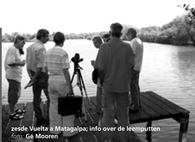
zesde Vuelta a Matagalpa; info over de leemputten