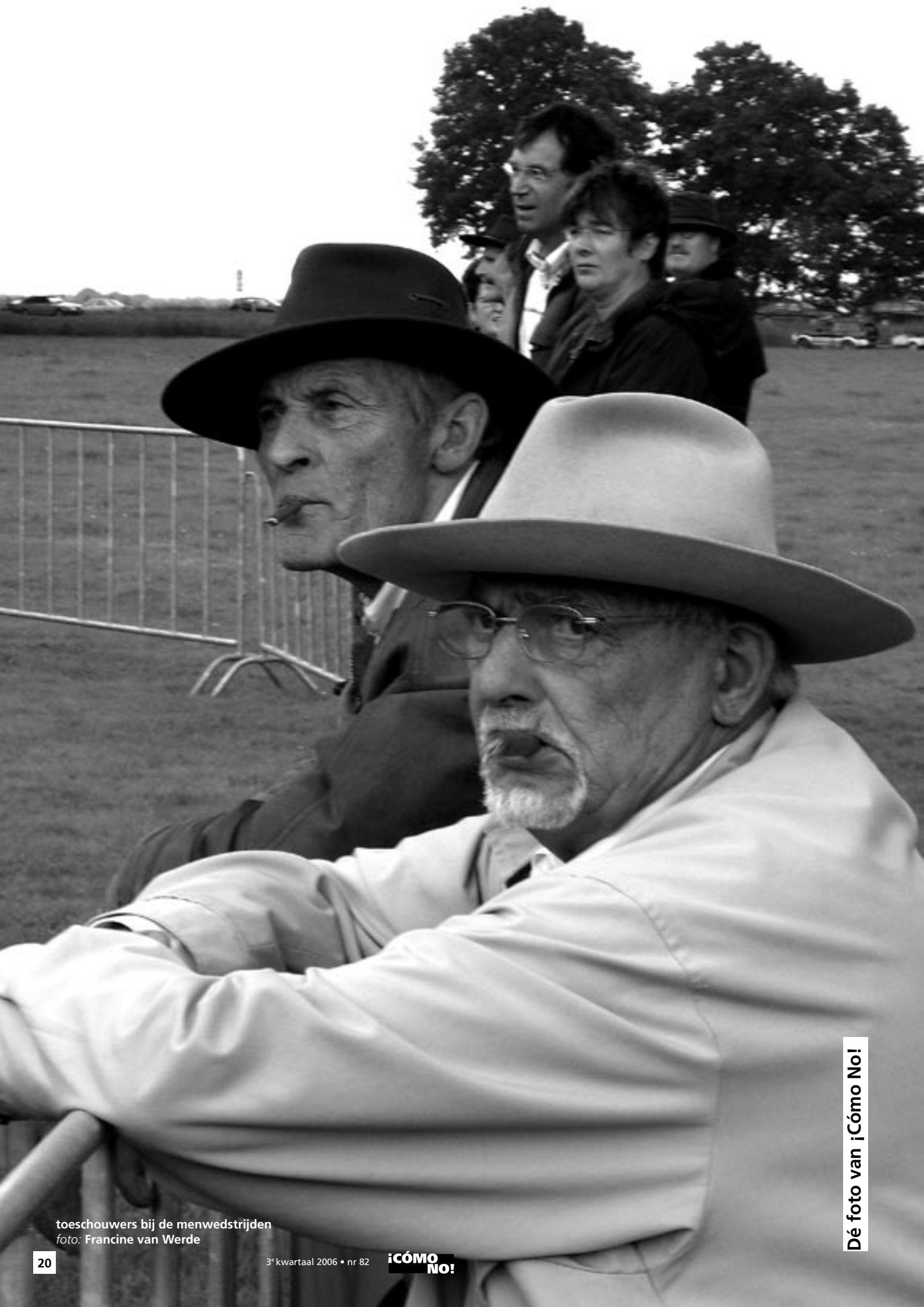
toeschouwers bij de menwedstrijden