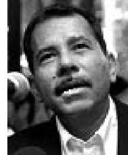
Daniel Ortega; FSLN