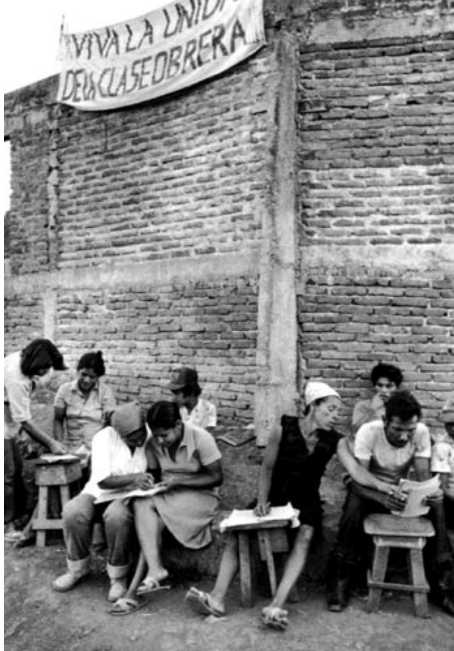
taalles in het departement Matagalpa (1980)

Vanaf 1990 zijn heel wat veranderingen ongedaan gemaakt door het neo-liberale tijdperk, maar de monden van de vrouwen waren niet meer te snoeren. En nog steeds laten de vrouwen zien dat ze de strijd niet opgeven. Gladys Baéz vertelt haar verhalen van een tijd die zich niet mag herhalen.