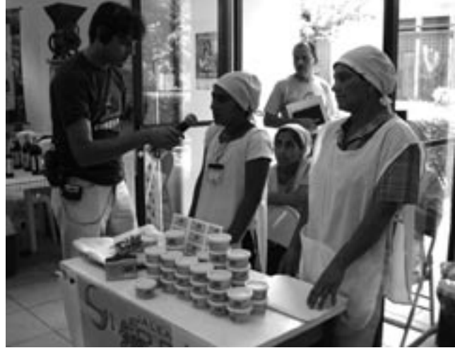
interview door lokale pers

bedrijven vertegenwoordigd zijn, opgesteld. Het plan onderscheidt een vijftal thema's: productie/economie, sociaal/cultureel, milieu, gender en planning/ruimtelijke ordening. Het is belangrijk om te melden dat de commissie voor gender-gelijkheid zeer actief is. Zij heeft ervoor gezorgd dat aandacht voor mannen en vrouwen ook in de andere thema's doorwerkt.'