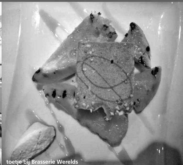
toetje bij Brasserie Werelds