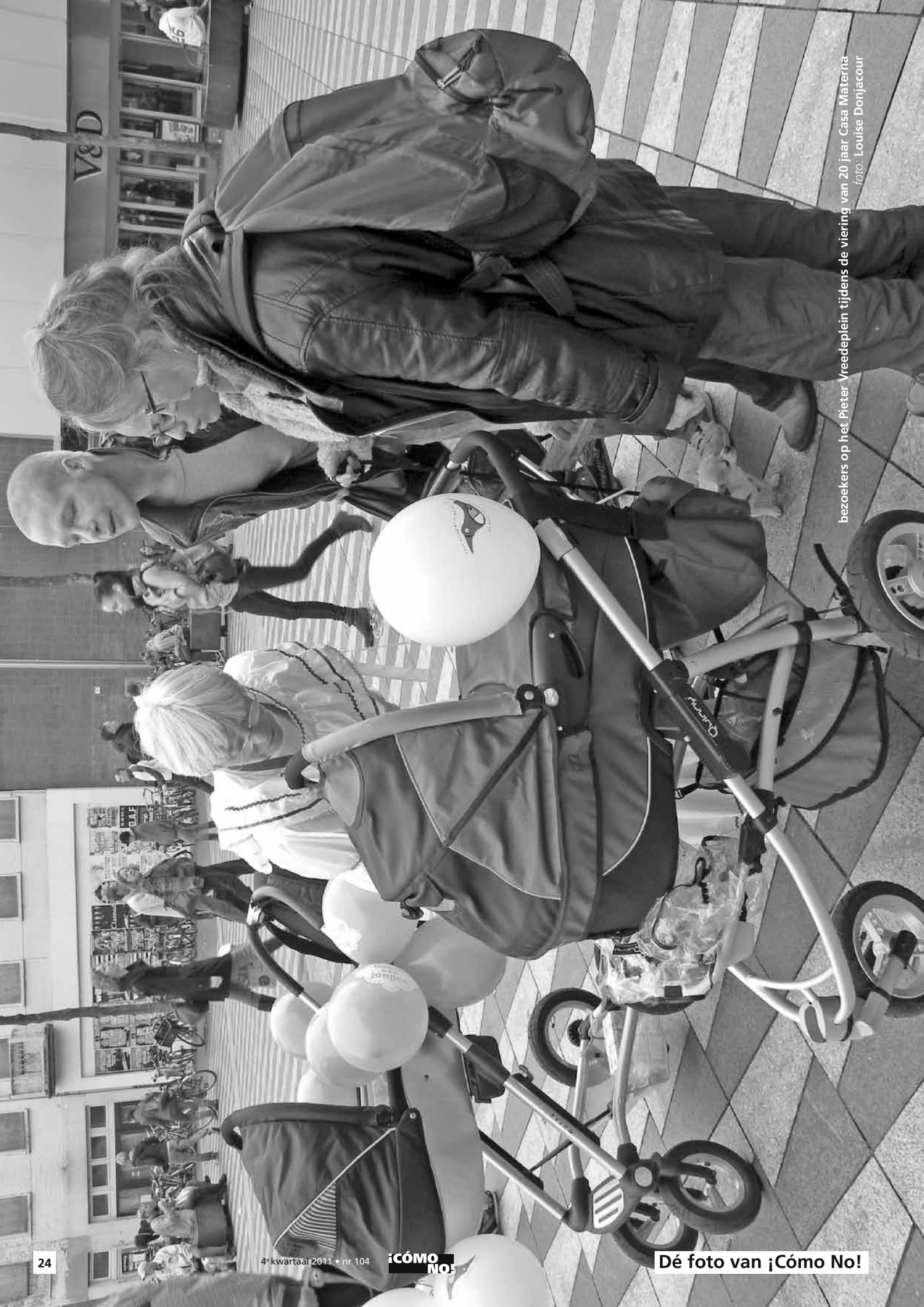
bezoekers op het 'Pieter' Vreedeplein tijdens de viering van 20 jaar Casa Materna