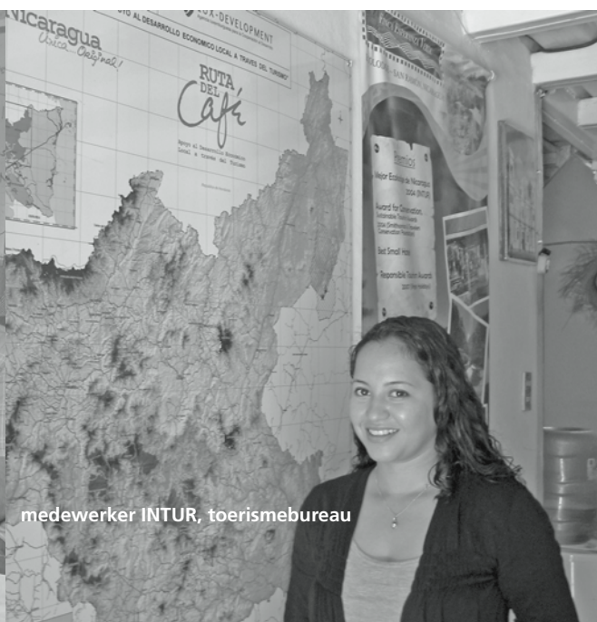
medewerker INTUR, toerismebureau