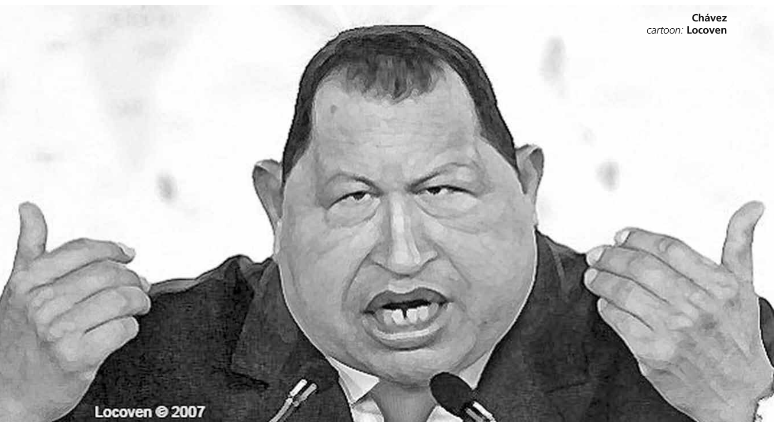
Chávez cartoon: Locoven

www.dewereldmorgen.be/.../ortega-wint-verkiezingen-in-nicaragua