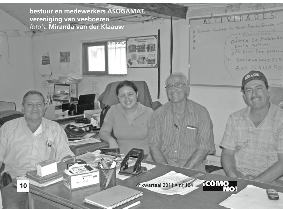
bestuur en medewerkers ASOGAMAT, vereniging van veeboeren