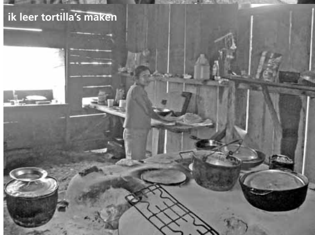
ik leer tortilla's maken