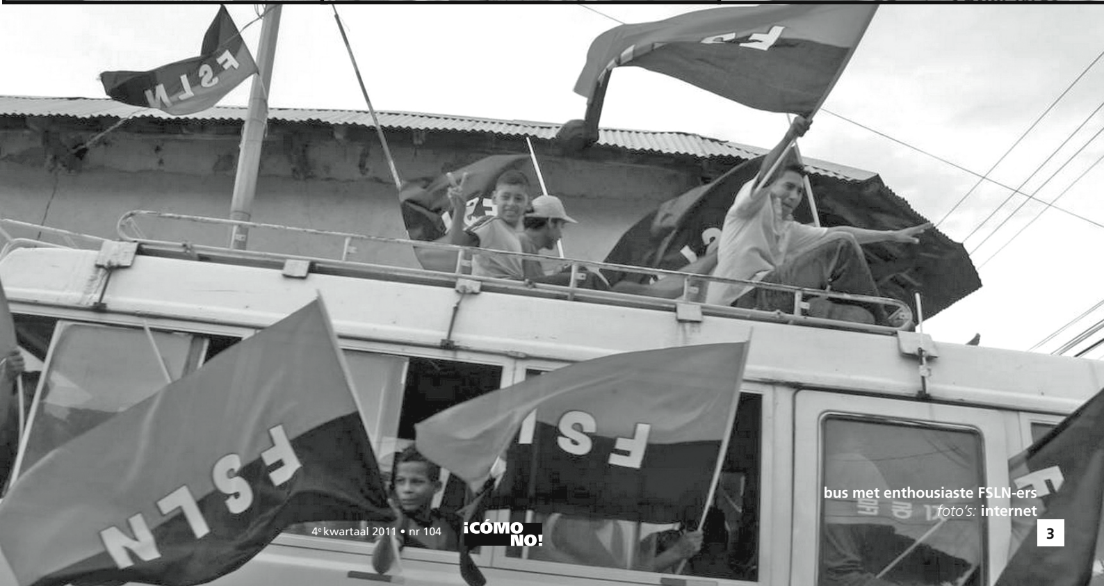
bus met enthousiaste FSLN-ers