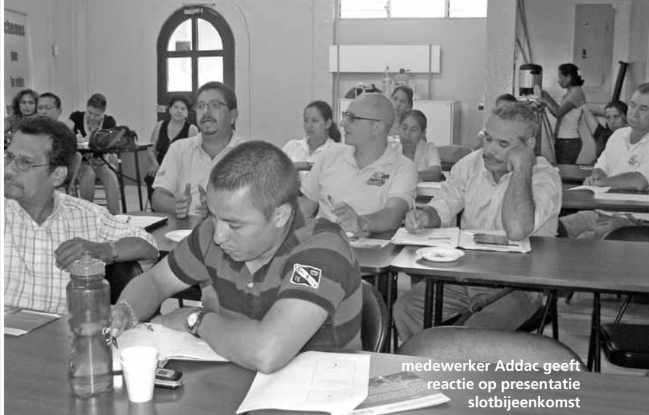
medewerker Addac geeft reactie op presentatie slotbijeenkomst