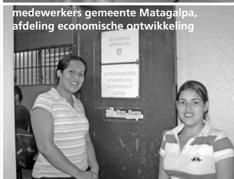
medewerkers gemeente Matagalpa, afdeling economische ontwikkeling