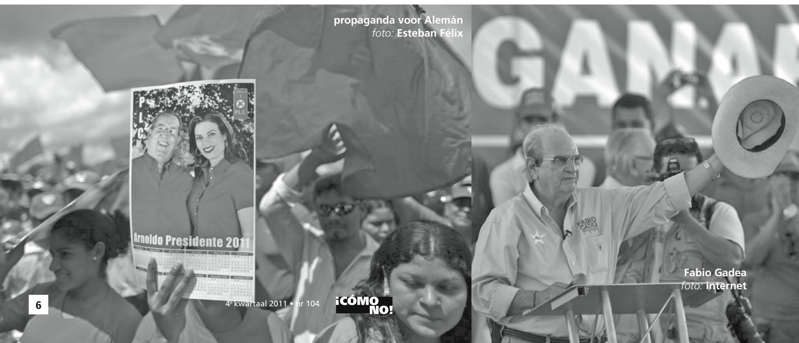
propaganda voor Alemán