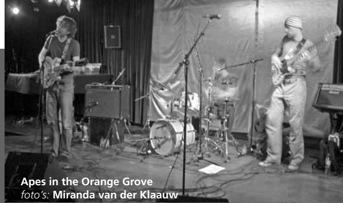
Apes in the Orange Grove