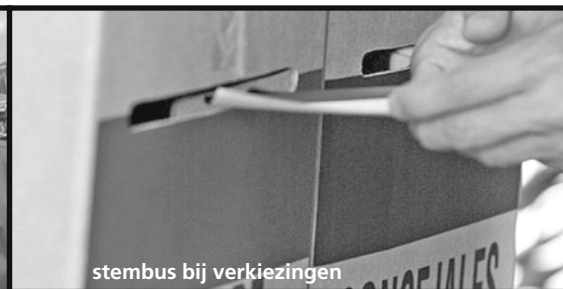
stembus bij verkiezingen