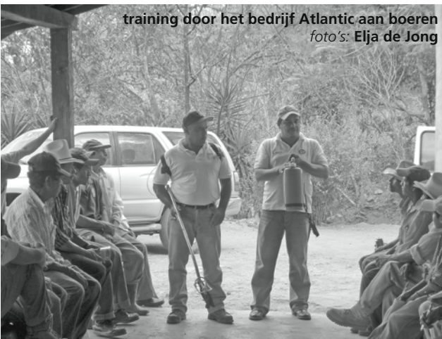
training door het bedrijf Atlantic aan boeren

Elja de Jong is afgestudeerd in International Development Studies aan de Universiteit van Utrecht. Voor haar afstudeeronderzoek is zij van februari tot juni 2011 in Nicaragua geweest waar zij een onderzoek heeft gedaan naar inclusive business in de koffiesector. Inclusive business is een initiatief dat wordt uitgevoerd door onder andere de Nederlandse ontwikkelingsorganisatie SNV. Dit artikel betreft echter de reflecties van een onafhankelijk onderzoek en SNV kan niet verantwoordelijk worden gehouden voor de inhoud.