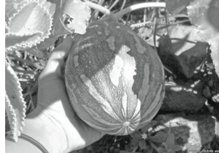
mooie oogst in moestuin

Tijdens het bezoek van afgelopen augustus aan Matagalpa is er uiteraard ook gelegenheid geweest om over milieuprojecten te praten. Samen met Miranda heb ik met de verschillende organisaties gesproken over enerzijds nieuwe projecten, anderzijds over lopende zaken. De lopende zaken zijn het moestuinenproject (waarover in de vorige ¡Cómo No! al uitvoerig is gerapporteerd) en het project over de biogasinstallaties (ook al eerder over geschreven).