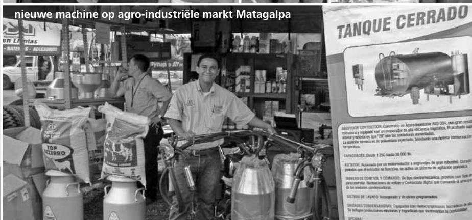
nieuwe machine op agro-industriële markt Matagalpa