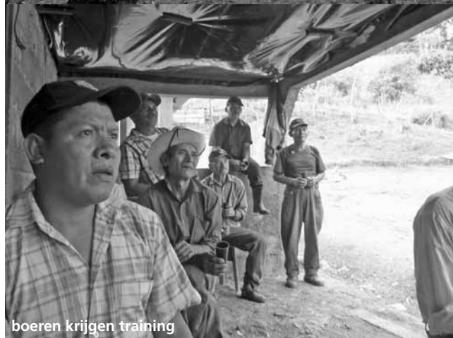
boeren krijgen training