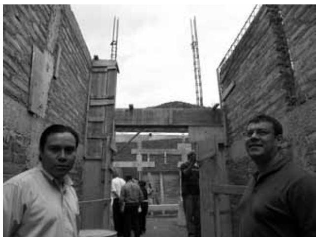
Clinica in aanbouw