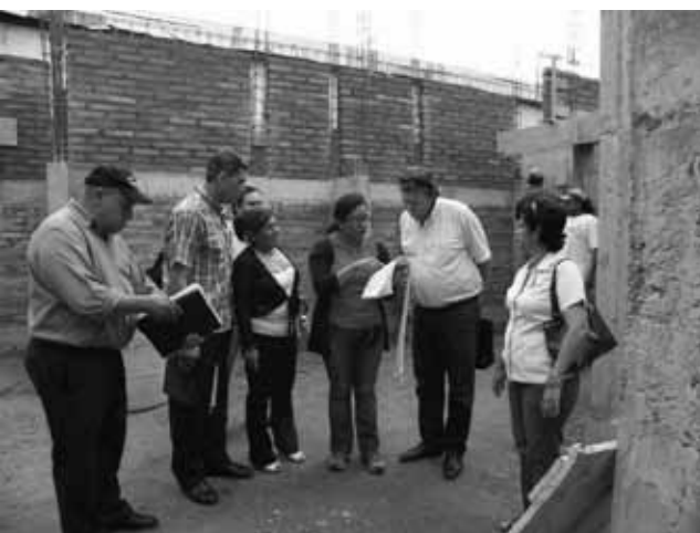
uitleg voortgang bouw

Na het verblijf op de bouwplaats overleggen ministerie van Gezondheid, gemeente Matagalpa en het Landelijk Beraad Stedenbanden Nederland-Nicaragua (LBSNN) over de voortgang en de financiële kanten van het project. De aannemer heeft zelf de bouw voorgeschoten om zo geen garantie te hoeven afgeven bij de gemeente. Hij heeft nu wel een eerste afrekening ingestuurd. Deze is gecontroleerd door de supervisor van de gemeente en wordt ter plekke overgedragen aan de supervisor van het LBSNN. Na de goedkeuring van het rapport zal LBSNN aan gemeente Matagalpa de tweede uitbetaling beschikbaar stellen. Inzake de aanschaf van medische apparatuur wordt volgens afspraak de gemeente Matagalpa uitgenodigd om in samenwerking met het ministerie conform de begroting van het goedgekeurde project de offertes, documentatie en dergelijke te overleggen voor de aanschaf. Na goedkeuring door LBSNN zal een eerste uitbetaling plaatshebben. Inzake de ambulance wordt vastgesteld dat het ministerie van Gezondheid deze het goedkoopst kan aanschaffen. Ook hier verzoekt LBSNN documentatie en offertes te overleggen alvorens te kunnen overgaan tot betaling.