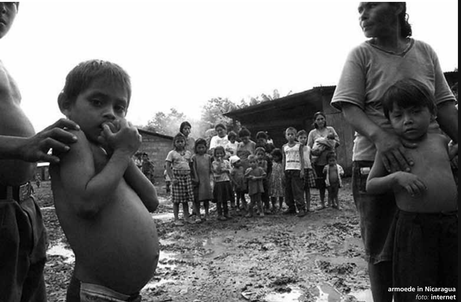
armoede in Nicaragua

Belangrijkste factor voor de afname van armoede en ongelijkheid is de economische groei tussen 2003 en 2008. De prijzen voor (geëxporteerde) grondstoffen waren hoog, >>