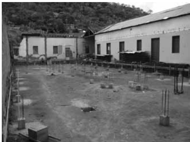
de fundering

Het probleem van het niet kunnen aanleveren van bouwmaterialen op de locatie van het moeder- en kindcentrum doet zich straks ook voor met het aanrijden van de ambulance. Zwangere vrouwen moeten nu eerst via een lange gang door het oude gebouw om vervolgens in de Clinica te komen. Het ministerie en de gemeente onderkennen de situatie en in opdracht van de burgemeester wordt nu een aantal scenario's uitgewerkt om te komen tot bouwkundige aanpassing aan het oude gebouw waardoor de Clinica een eigen hoofdingang zou kunnen krijgen. De kosten worden geschat op ongeveer 5000 dollar. Hierover moet nog wel besluitvorming plaatsvinden. Ministerie en gemeente stellen verder voor om een derde behandelkamer te installeren, inclusief airconditioning. Extra kosten hiervan zijn ongeveer 20.000 dollar. De Clinica beschikt dan over drie toegeruste behandelkamers inclusief airconditioning.