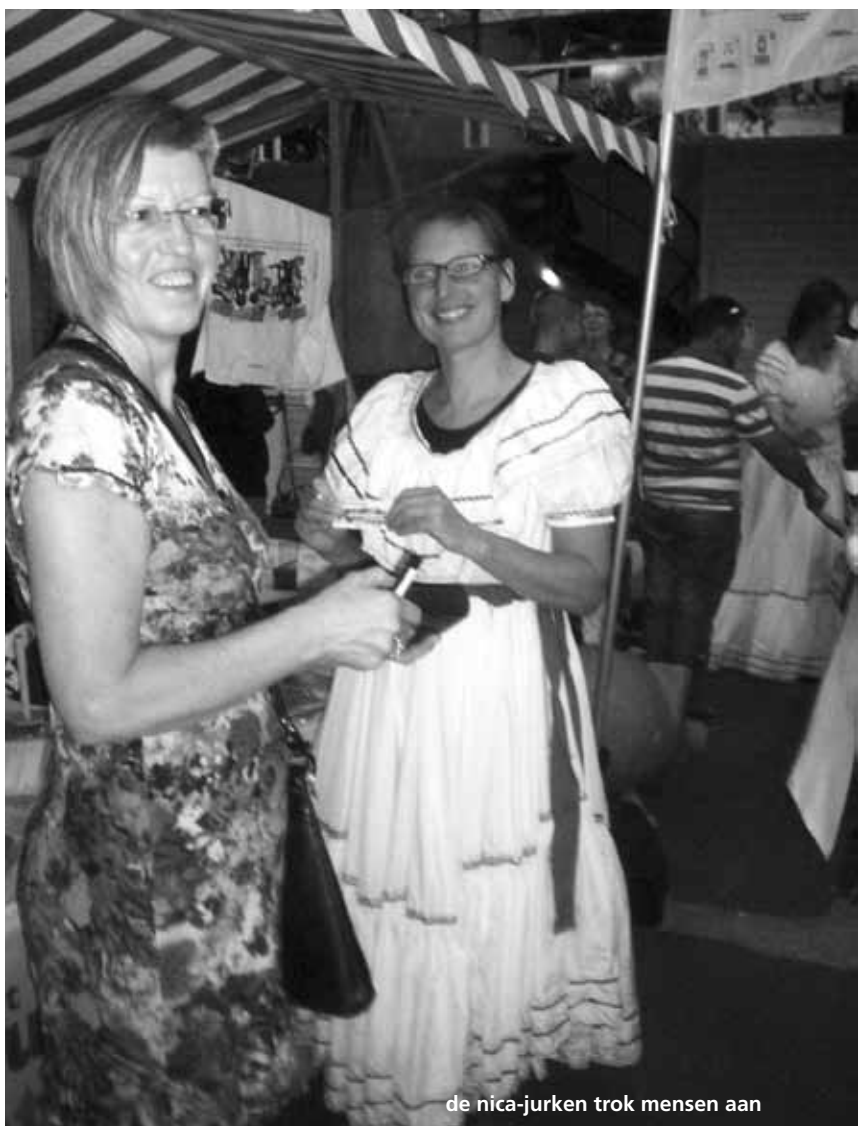
de nica-jurken trok mensen aan

* Positoos is een spaarsysteem dat een verbinding legt tussen de lokale bevolking, verenigingen en de lokale ondernemers. Met Positoos spaar je bij de ondernemers in je eigen buurt. Als Positoos-spaarder ontvang je een persoonlijke spaarpas met chip. Hiermee krijg je korting en kunt je gebruik maken van speciale acties en aanbiedingen bij de aangesloten ondernemers. Het bijzondere van Positoos is dat je niet alleen voor jezelf spaart, maar ook voor je vereniging.