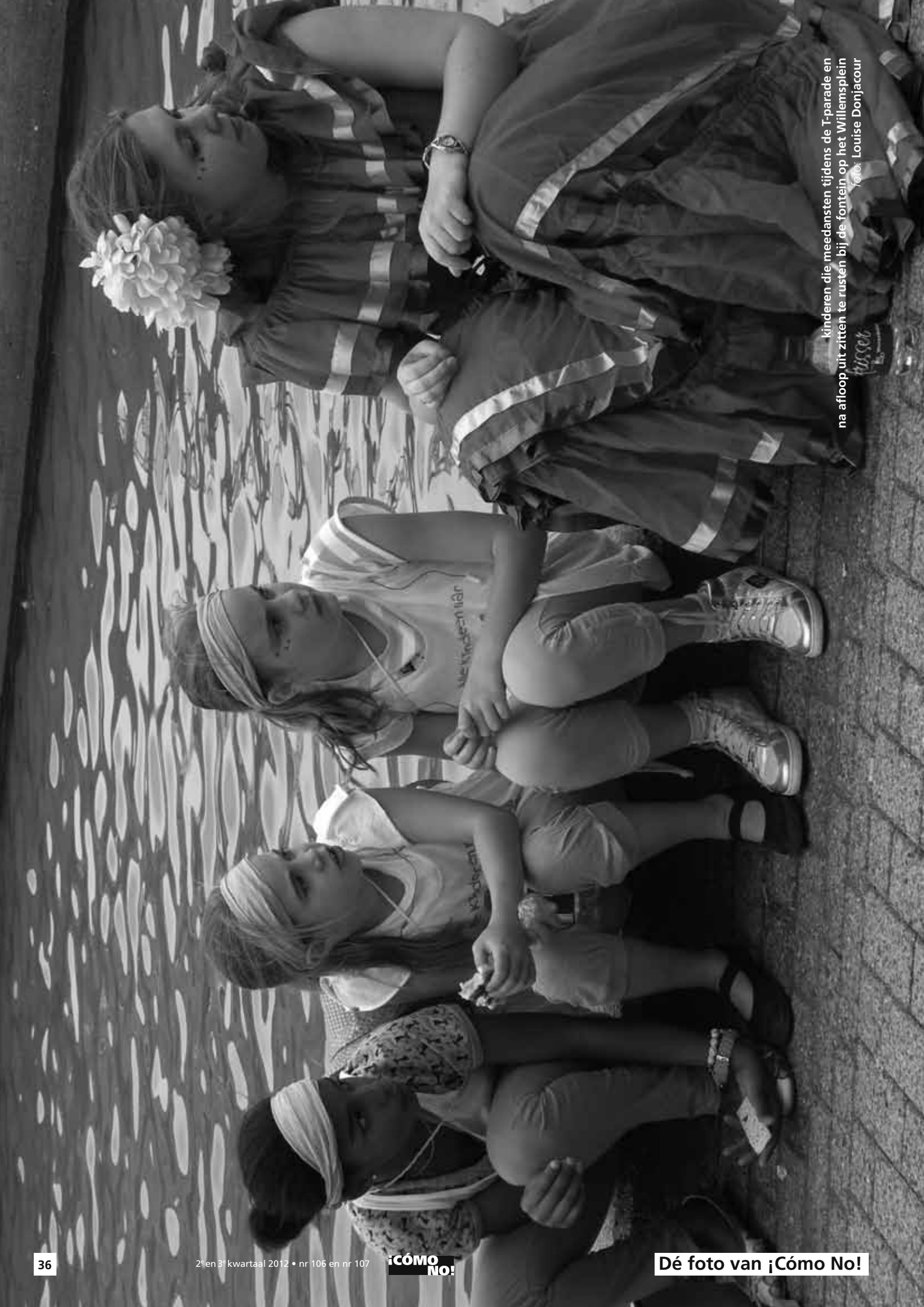
kinderen die meedansen tijdens de T-parade en na afloop uit zitten te rusten bij de fontein op het Willemsplein