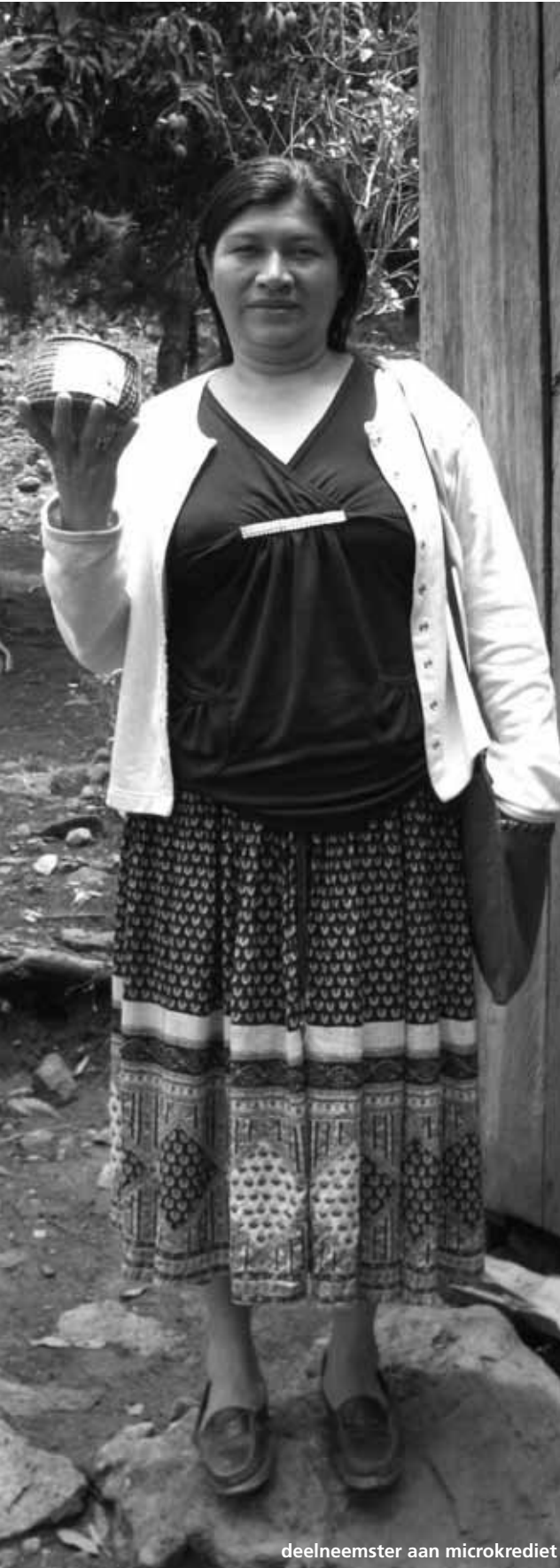
deelnemster aan microkrediet

Microkrediet wordt vaak verkocht als een wondermiddel. In de uitzending van Tegenlicht van 6 februari 2012 kwam scherpe kritiek naar voren: microkrediet zou leiden tot macroschulden. Die kritiek snijdt hout, maar moet wel in een context gezet worden. Vanuit de Stedenband Tilburg-Matagalpa hebben we positieve ervaringen met het geven van microkrediet. De organisatie waar de Stedenband gezamenlijke projecten mee heeft, FUMDEC in Matagalpa, vervult wat ons betreft een voorbeeldfunctie. Zij beoordelen de binnenkomende aanvragen kritisch. Door de intensieve samenwerking met hen wordt duidelijk dat er nog veel problemen op te lossen zijn, maar ook dat er steeds meer sturing komt.