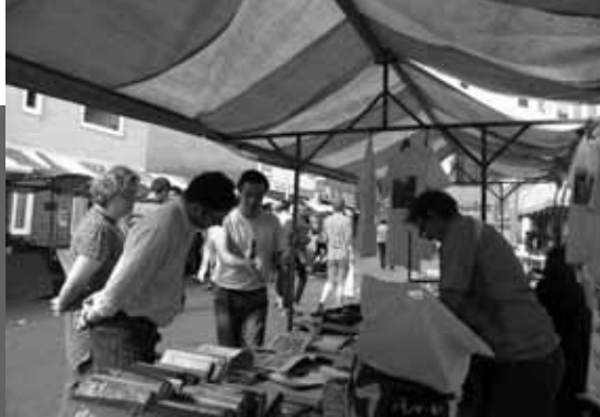
boekenkraam tijdens Koninginnemarkt