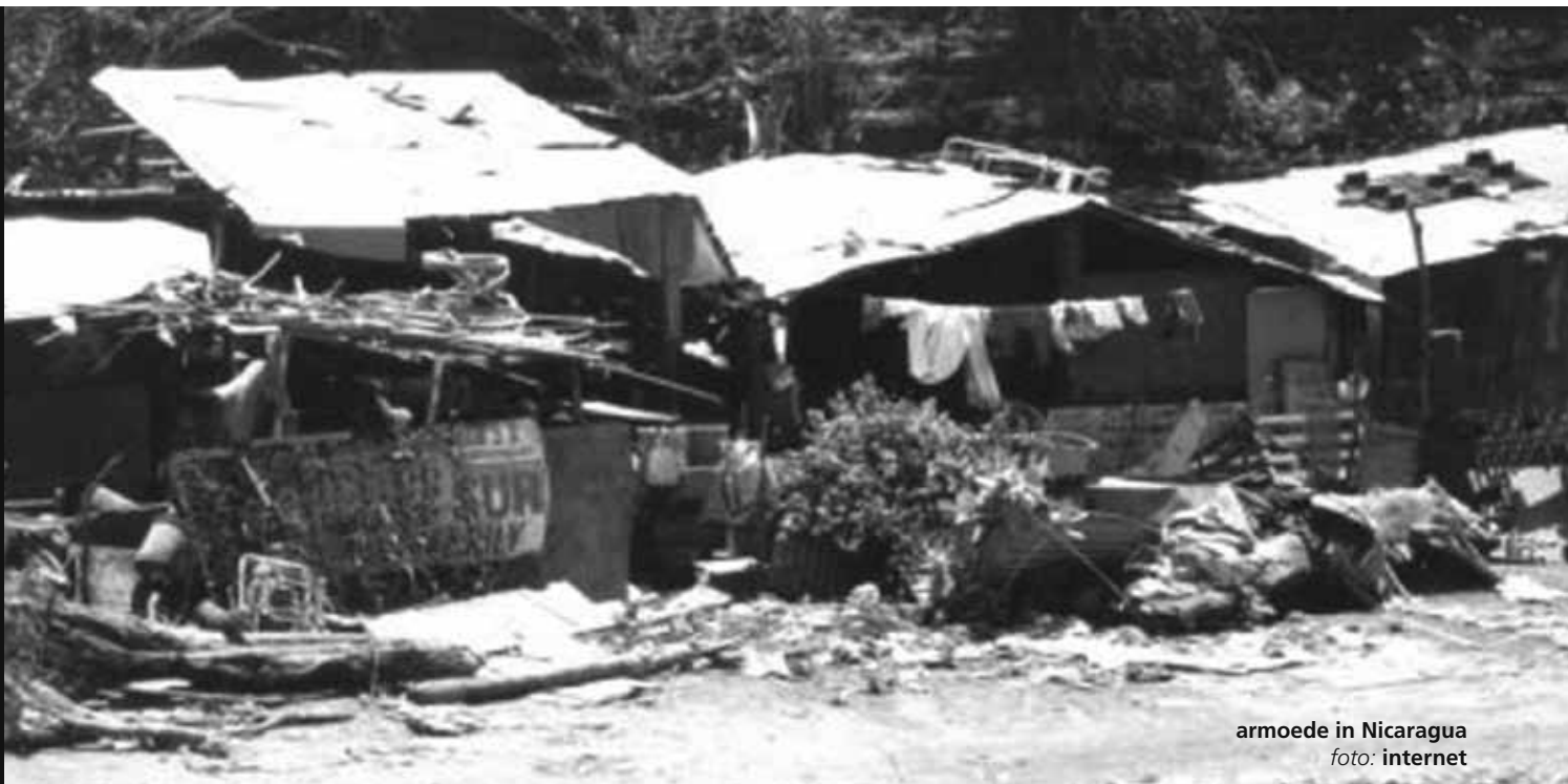
armoede in Nicaragua

er was meer werk (in de formele sector) en er werd beter betaald. Maar daarnaast hebben overheden, zowel van linkse als rechtse signatuur, een beter sociaal beleid gevoerd, dankzij die economische groei. De sociale uitgaven per inwoner zijn gemiddeld met 75 procent gestegen. In diverse landen bestaan uitkeringsprogramma's voor de armste groepen. Deze bijdragen zijn met name van belang opdat de armen hun kinderen naar school sturen (dit is vaak een voorwaarde voor de uitkering).