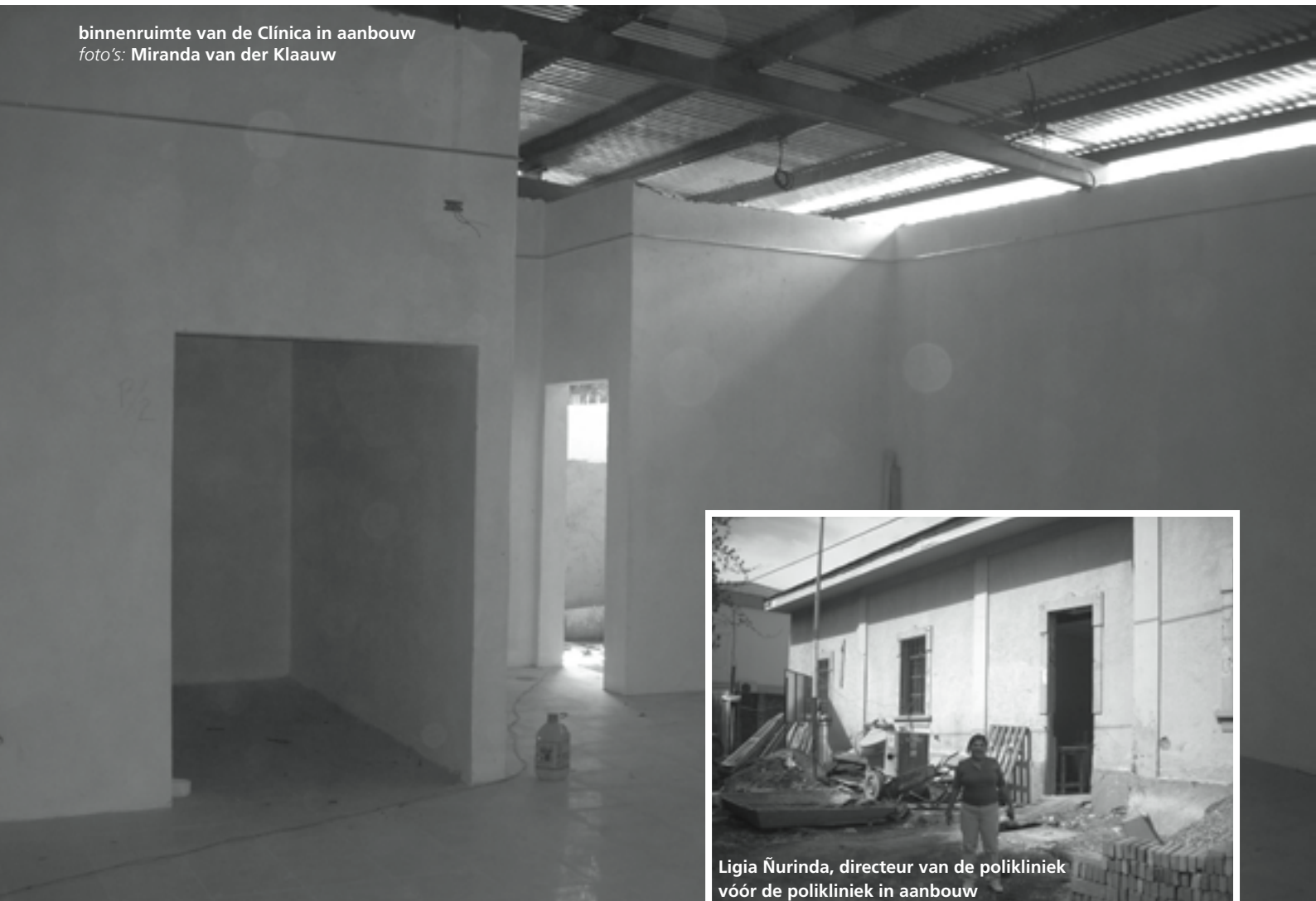
binnenruimte van de Clínica in aanbouw