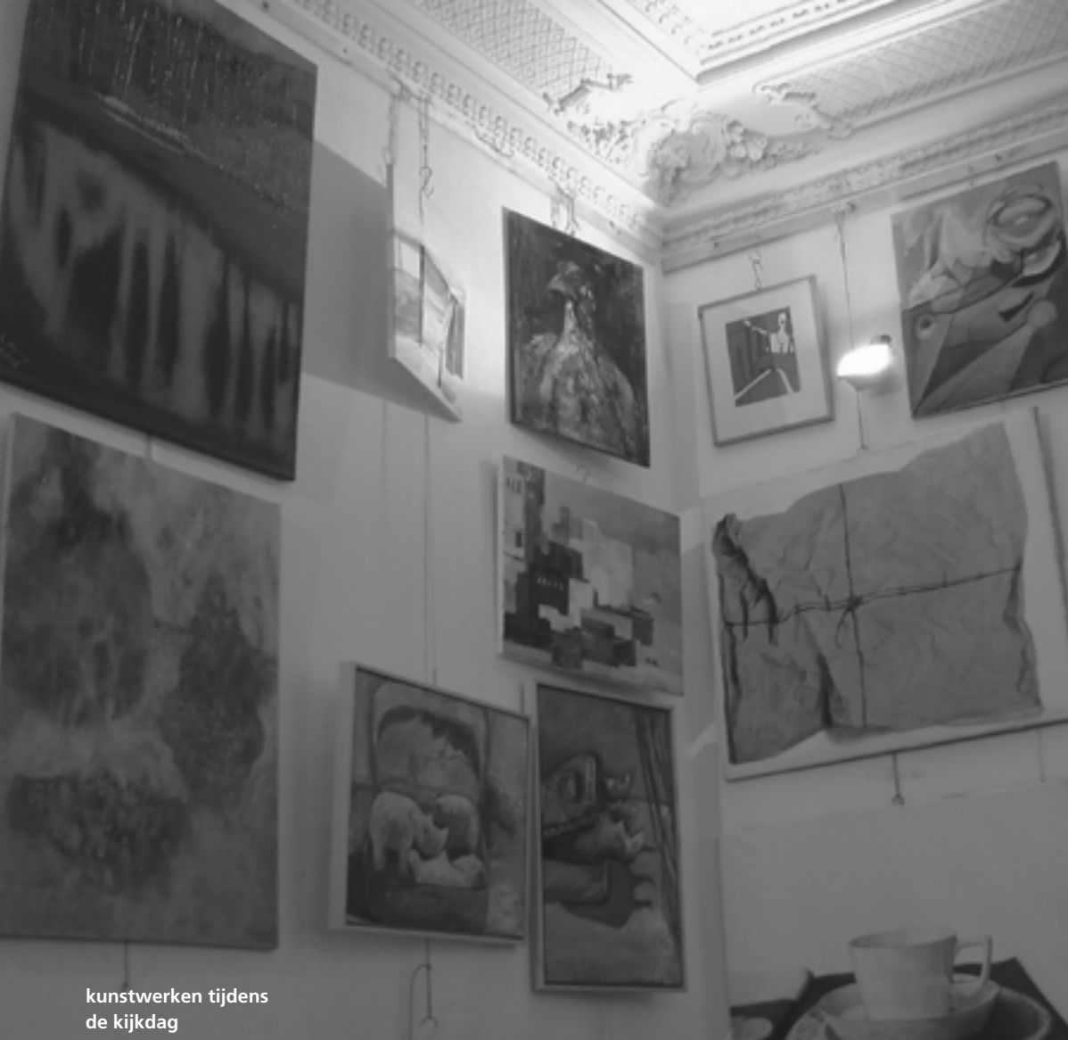
kunstenwerken tijdens de kijkdag