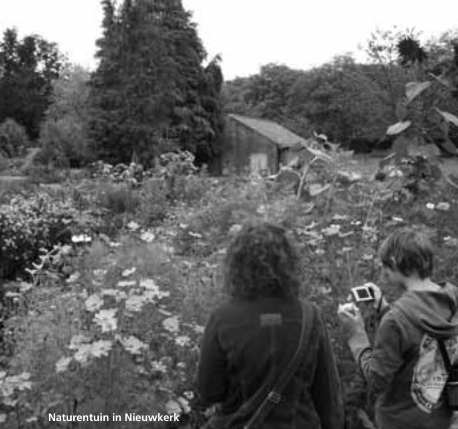
Naturetuin in Nieuwkerk

een traditionele (handgedreven) appelpers in actie op een boerderij in Nieuwkerk