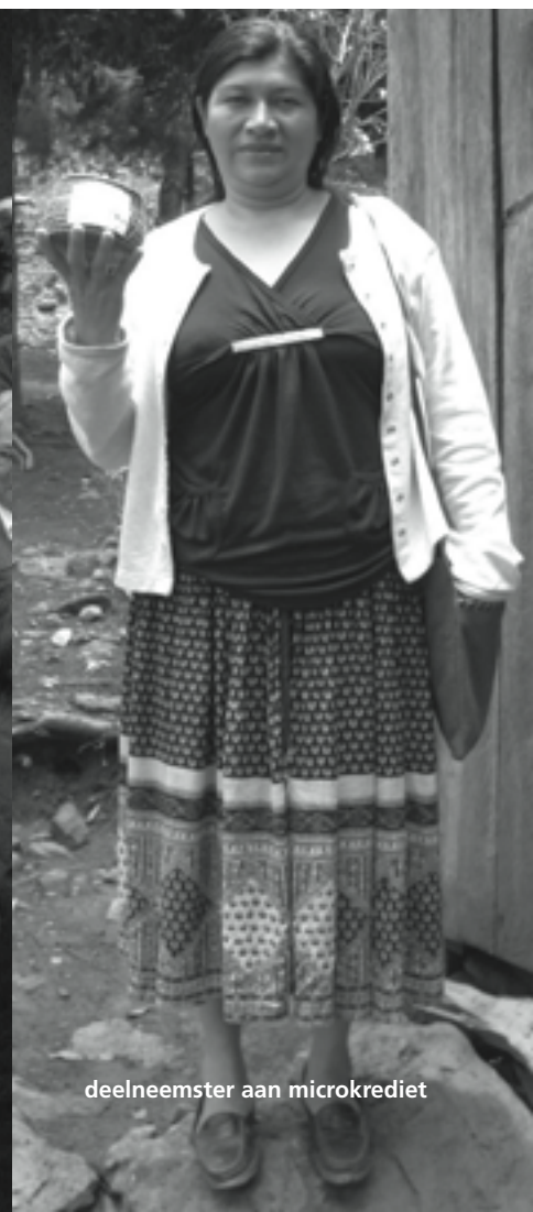
deelnemster aan microkrediet