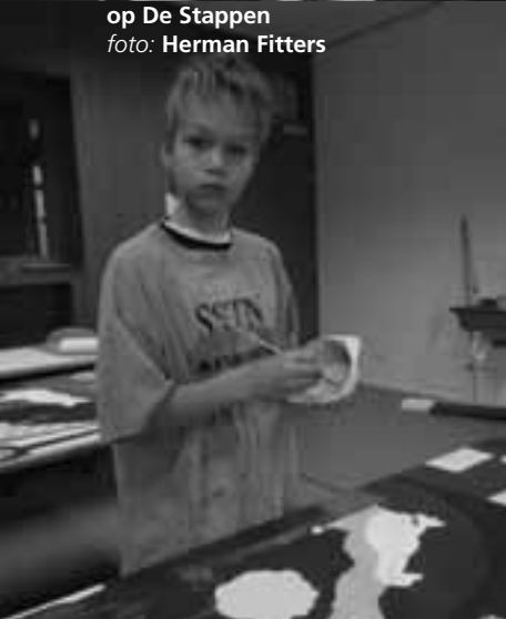
op De Stappen