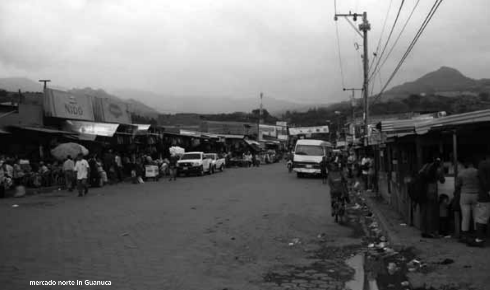
mercado norte in Guanuca