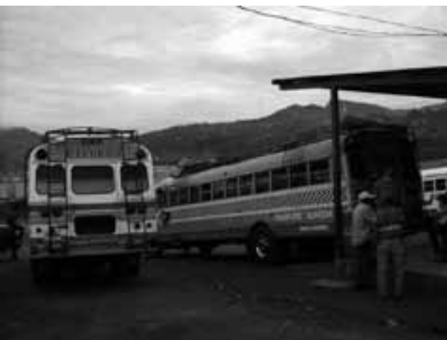
busstation op de mercado norte