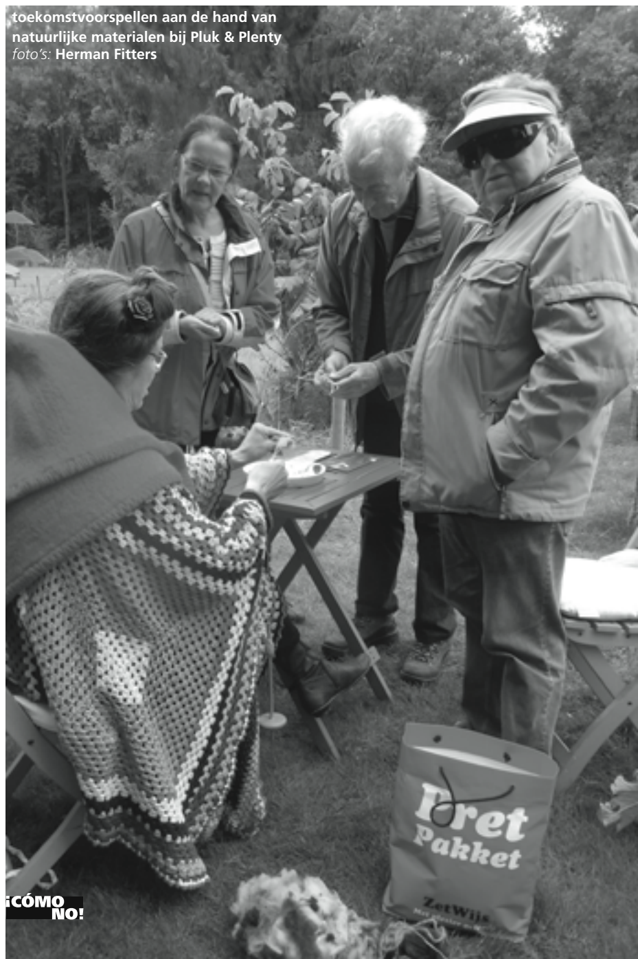
toekomstvoorspellen aan de hand van natuurlijke materialen bij Pluk & Plenty

bloemen, groenten, een boomgaard, bijen en een grote vijver. Er stond een kraampje met voorlichting over Velt, een van oorsprong Belgische vereniging voor ecologisch tuinieren. Binnen was een ruimte waar een voorlichtingsfilm te zien was. Er waren ook hier weer veel mensen, en een goede sfeer. In de tuin kwam ik Roy tegen, hij was in de vijver waterdiertjes aan het vangen met een schepnet. Hij had een kaart waarop hij de gevangen diertjes kon opzoeken. Hier had ik ook wel wat langer willen blijven, maar wij moesten als eersten aankomen bij het eindpunt.