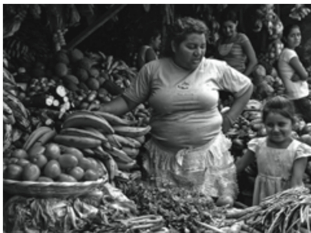
groentekraam op de mercado norte

Heel deze koortsachtige bedrijvigheid ontwikkelt zich door de opeenstapeling van voertuigen en mensen wanordelijk en rommelig. Sinds haar ontstaan is de markt in Guanuca gebaseerd op improvisatie. Van een punt waar mensen en handelswaar afkomstig van de meest productieve regio's van het departement de stad binnenkwamen, werd de markt langzamerhand getransformeerd tot