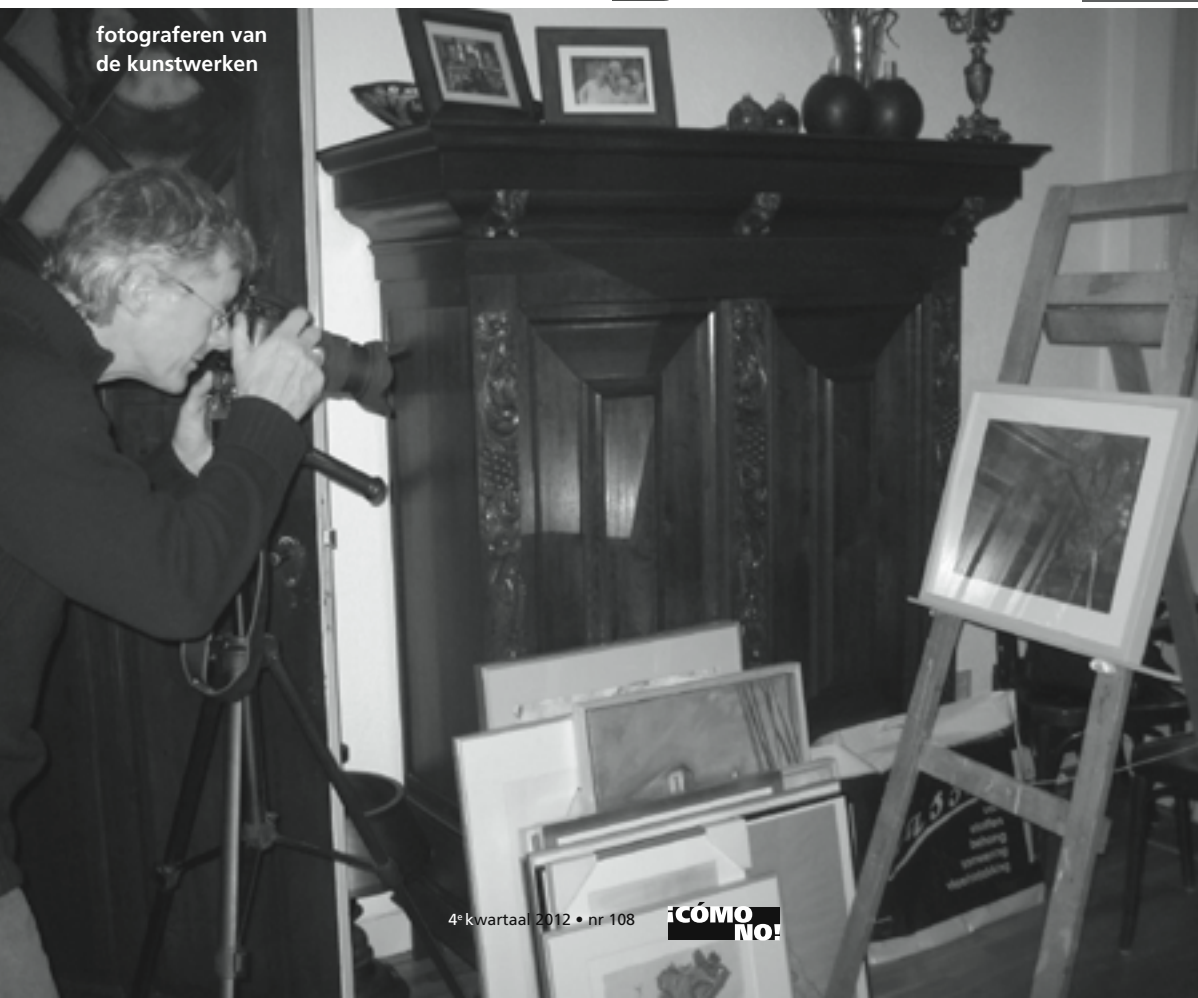
fotograferen van de kunstwerken