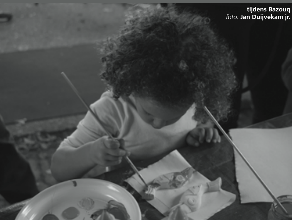
tijdens Bazouq