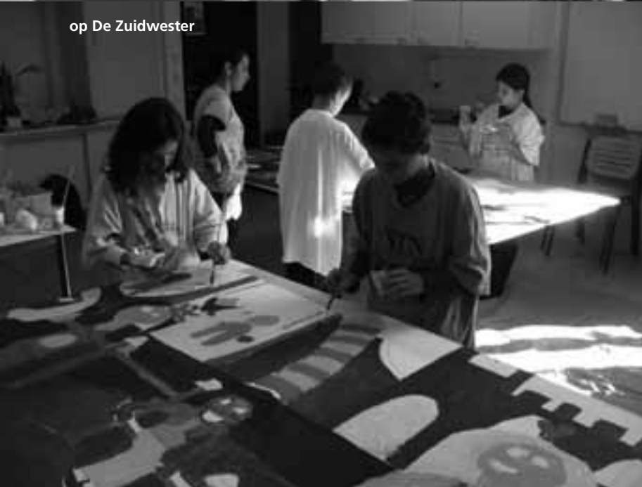
op De Zuidwester