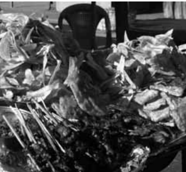
eetkraam op de mercado in Guanuca