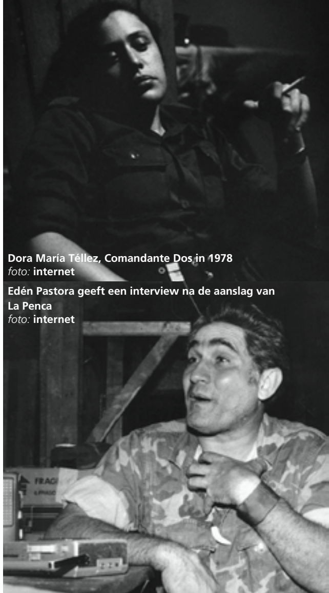
Dora María Téllez, Comandante Dos in 1978

De twee landen stonden inmiddels als kemphanen tegenover elkaar. De grote internationale steun voor Costa Rica inspireerde Daniel Ortega tot een felle binnenlandse toespraak waarbij hij Costa Rica, Guatemala, Panama, Mexico en Columbia beschuldigde van het verdedigen van de belangen van drugshandelaren. Hij stelde onomwonden dat Nicaraguaanse soldaten aan de grens verwickeld waren in een oorlog tegen drugs. Zijn onwrikbare houding inzake het conflict zorgt ervoor dat de steun voor Daniel Ortega in Latijns-Amerika er niet groter op werd. In eigen land genoot de president daarentegen wel de steun van een overgrote meerderheid.