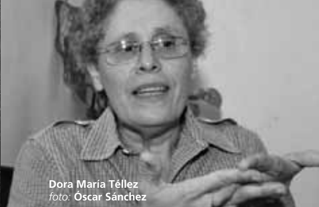
Dora María Téllez