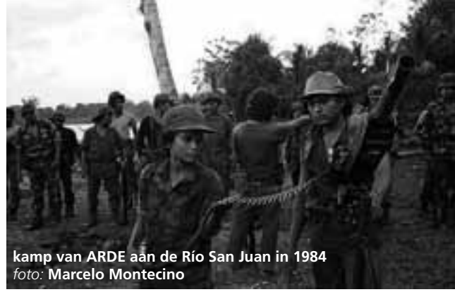
kamp van ARDE aan de Río San Juan in 1984

Wapens en geld in beperkte mate. Aan het Noorden (de contra's) gaven ze 600