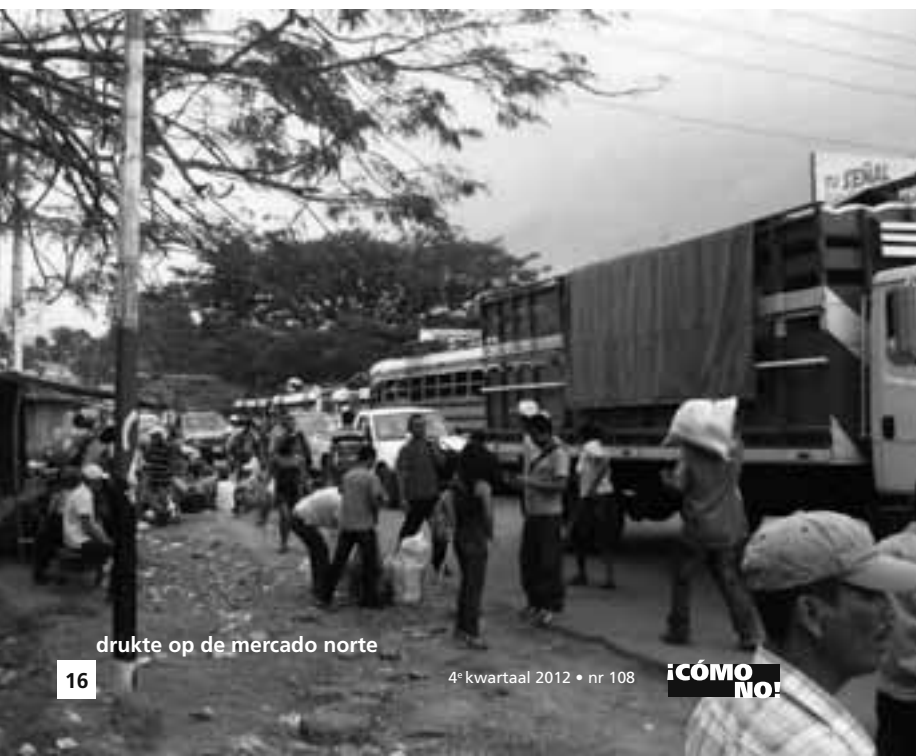
drukke op de mercado norte