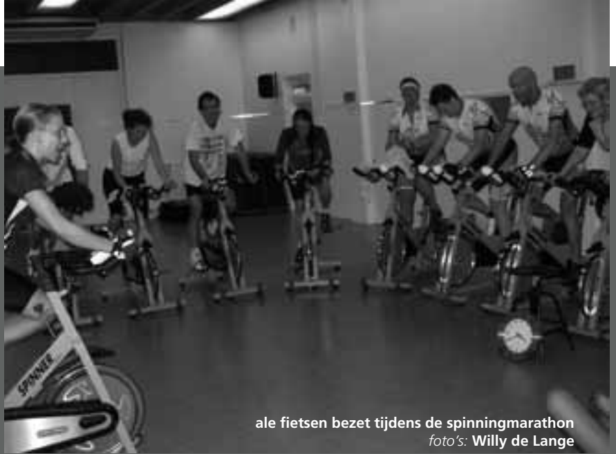
alle fietsen bezet tijdens de spinningmarathon

De Stedenband verhuist mee met COS Brabant, Stedenband Tilburg Same Tanzania en Stichting Werelddelen. Het Huis van de Wereld stopt, omdat het niet voldoende meerwaarde had; gemeente en provincie geven geen subsidie meer. Het pand aan de Spoorlaan wordt afgebroken. SNV en MST verhuizen naar andere panden in de stad.