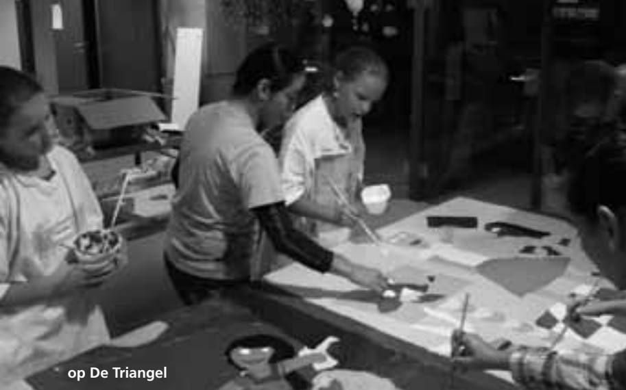
op De Triangel