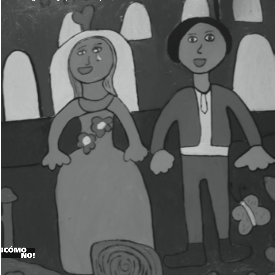
het Tilburgs-Matagalpese bruidspaar, met de traan