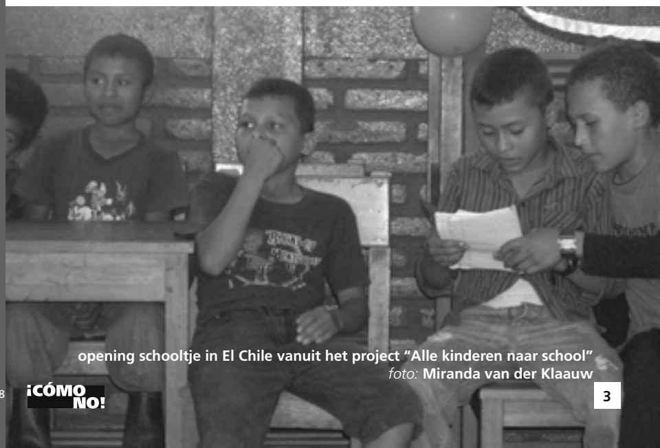
opening schoolje in El Chile vanuit het project "Alle kinderen naar school"