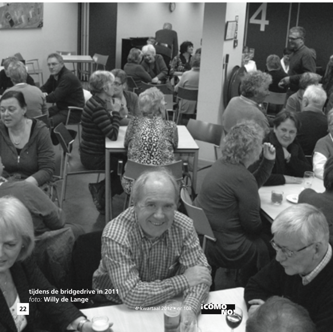
tijdens de bridgedrive in 2011