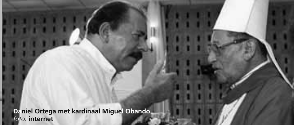
Daniel Ortega met kardinaal Miguel Obando

wordt geuit dat een gedeelte van dit geld aan de strijkstok blijft hangen.