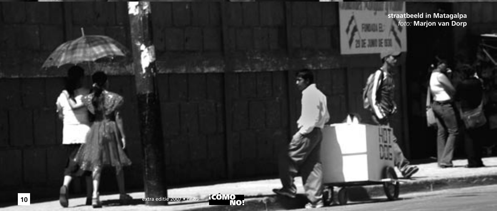
straatbeeld in Matagalpa