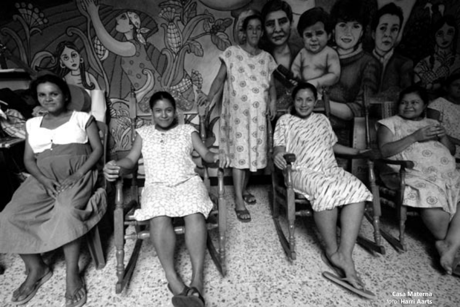
Casa Materna