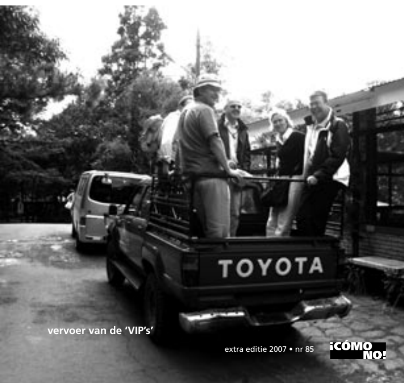
vervoer van de 'VIP's'