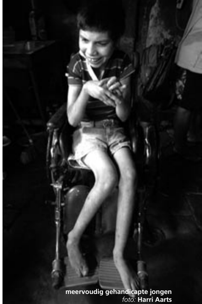
meervoudig gehandicapte jongen