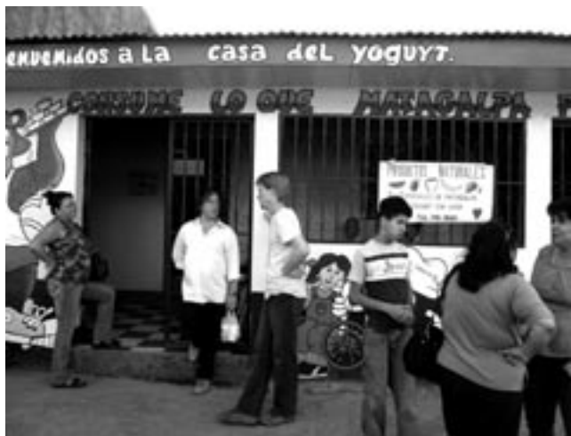
yoghurtfabriekje in Matagalpa

Onder leiding van de burgemeesters zijn we met een groot gezelschap met bobo's op pad gegaan. Tegen de achtergrond van een structurele schaarste aan middelen en mogelijkheden heeft dit wellicht een bepaald financieel verwachtingspatroon opgeroepen. Plannen werden ook, lopende het bezoek,