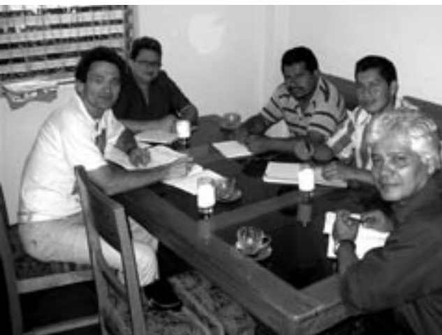
vergadering met het Comité Mano Vuelta en ANDEN