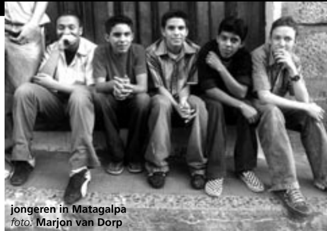
jongeren in Matagalpa