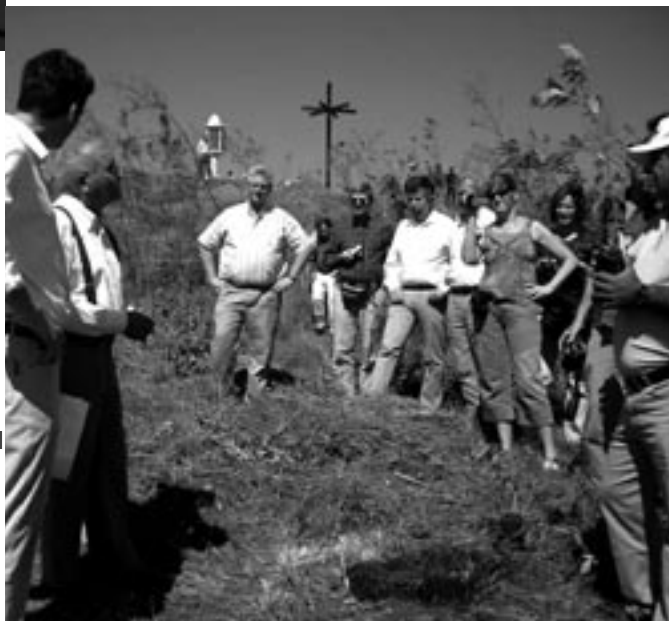
tijdens het planten op de berg Calvario, waar het Geboortebos komt

'Nicaragua is een arm en tegelijk rijk land'. Ik hoor het me zeggen bij de evaluatie van onze reis naar Matagalpa. We spreken met leden van het comité dat onze band als zusterstad vorm geeft. De armoede en de tekorten op alle gebieden (gezondheidszorg, werkgelegenheid onderwijs en volkshuisvesting) zijn confronterend. Maar de energie die we tegenkomen in alle projecten die we bezoeken is indrukwekkend. Het contrast is groot: aan de ene kant het deprimerende gevoel dat het lot van zieke en ondervoede kinderen oproept. Aan de andere kant het feest van het 145 jarige bestaan van de stad: de salsa, de missverkiezingen, de paarden en hun ruiters. Leerzaam, zo'n directe confrontatie, en tegelijkertijd een aanmoediging om te blijven ondersteunen. Alle onderlinge discussies in onze delegatie gaan over de vorm van die ondersteuning. Soms gaat het om directe hulp, zelfs op individueel niveau. Vaak gaat het over de vraag of we een bescheiden bijdrage kunnen leveren aan de meer duurzame ontwikkeling: het tegengaan van ontbossing, de opzet van beroepsonderwijs, het versterken van de gezondheidszorg, de verbetering van de volkshuisvesting. Het zijn vaak kleine stenen die we met de inwoners en het bestuur van Matagalpa in de rivier leggen. Stenen die ervoor zorgen dat de rivier iets meer de goede richting uitstroomt.