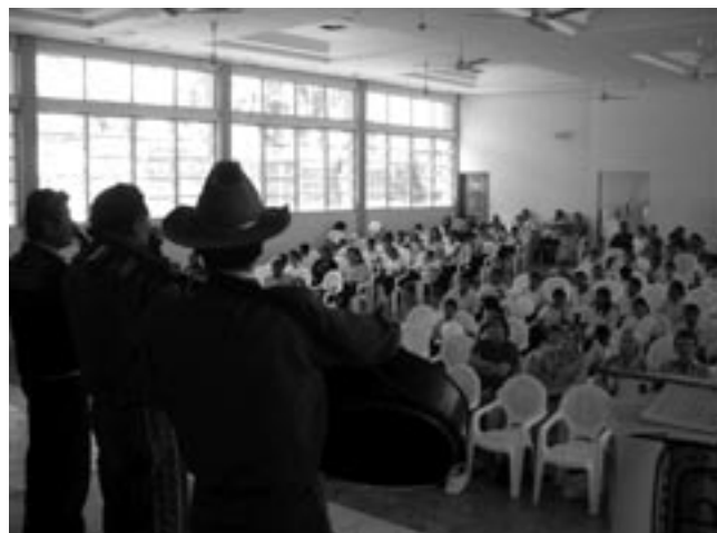
ontvangst op de universiteit van Matagalpa