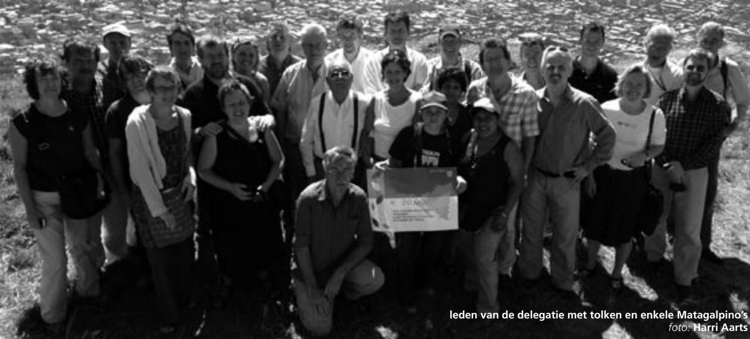
leden van de delegatie met tolken en enkele Matagalpino's