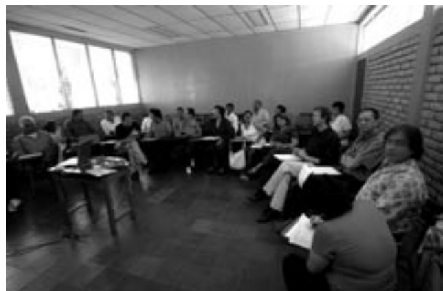
vergadering over onderwijs op de Universiteit van Matagalpa