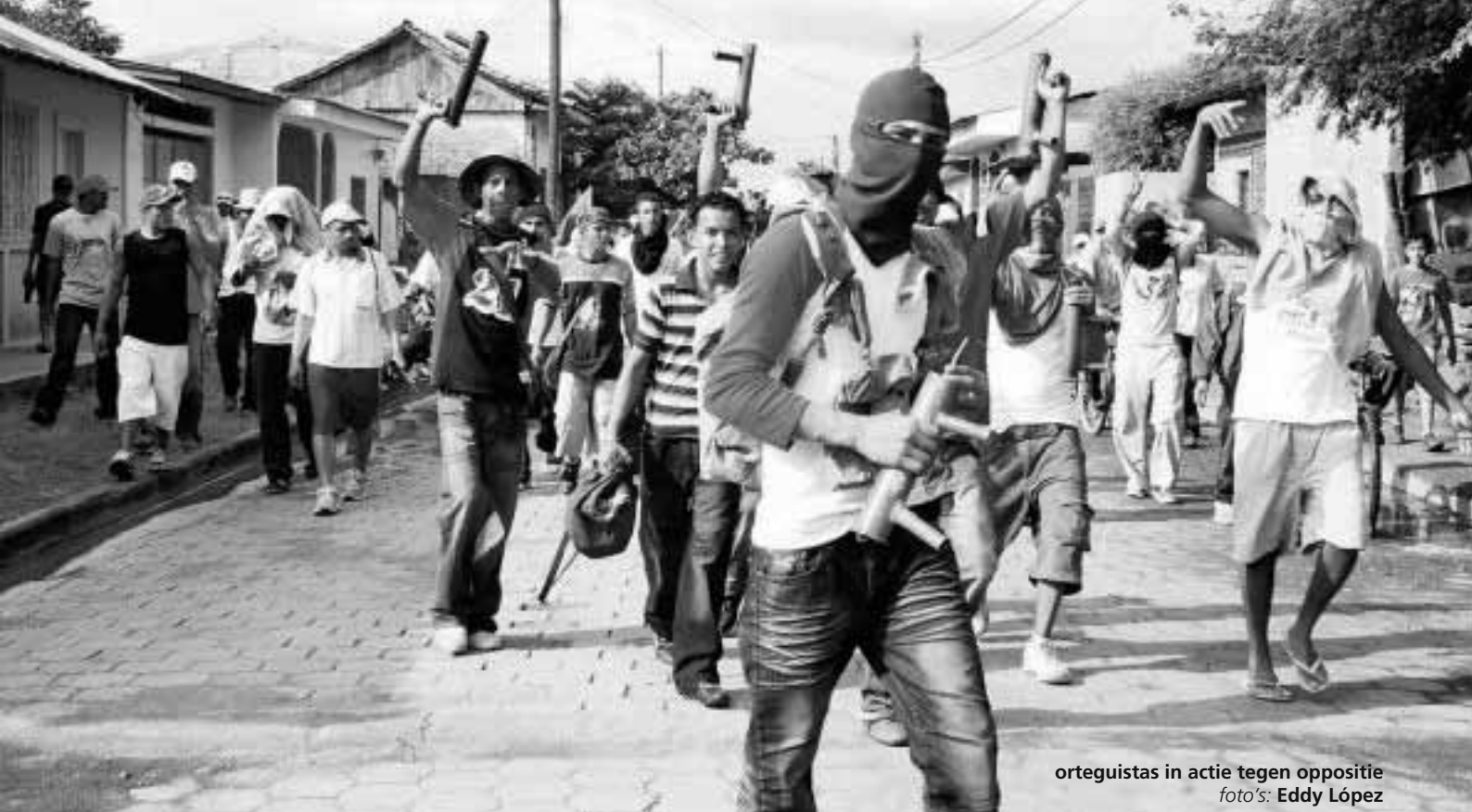
orteguistas in actie tegen oppositie

(na comandante Cero) bij de bezetting van het Nicaraguaanse parlement in 1978, en inmiddels beter bekend als fervent tegenstander van het orteguismo van Daniel Ortega.