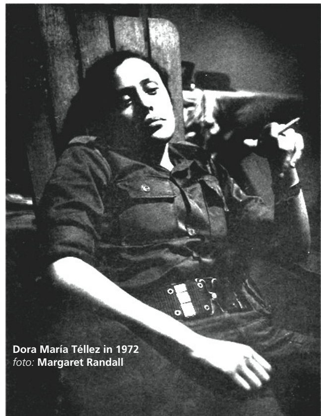
Dora María Téllez in 1972