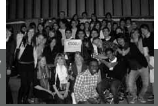
winnaar 2College Cobbenhagenlyceum