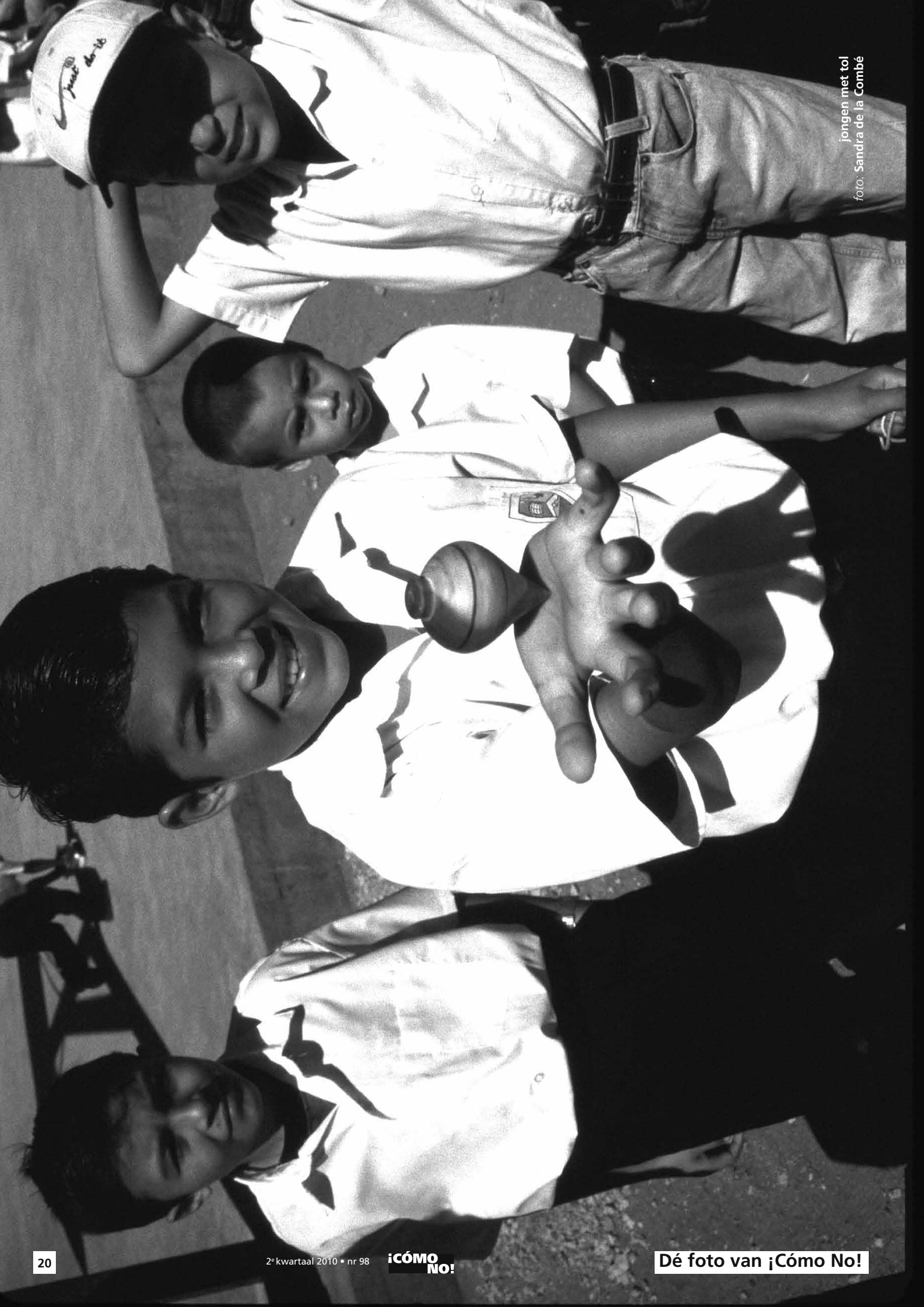
jongens met tol