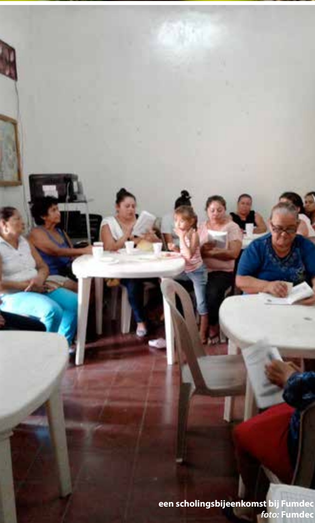
een scholingsbijeenkomst bij Fumdec