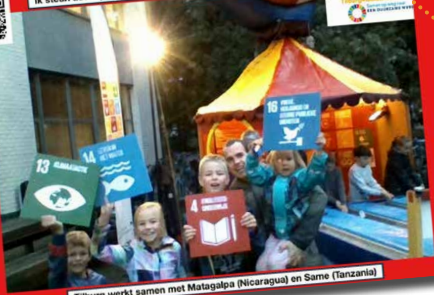
Tilburg werkt samen met Matagalpa (Nicaragua) en Same (Tanzania)