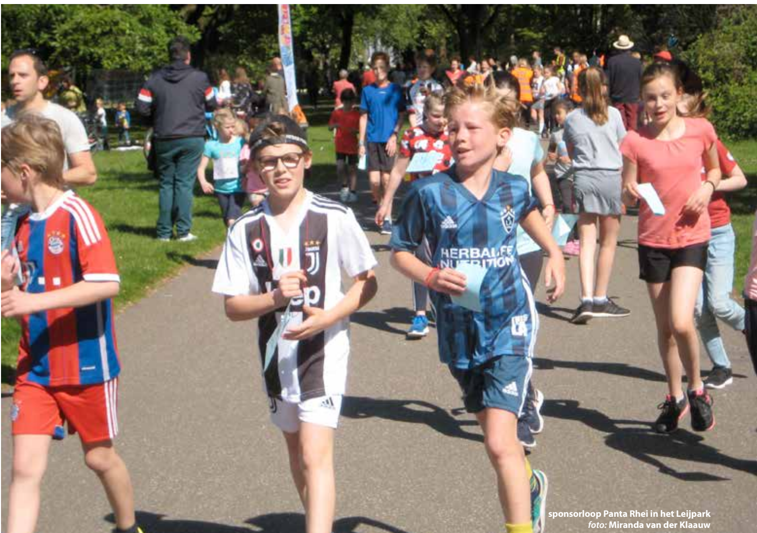
sponsorloop Panta Rhei in het Leijpark