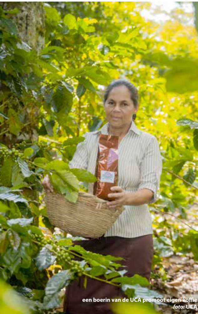
een boerin van de UCA promoot eigen koffie