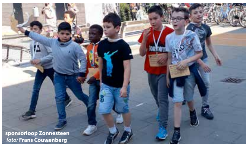
sponsorloop Zonnesteen