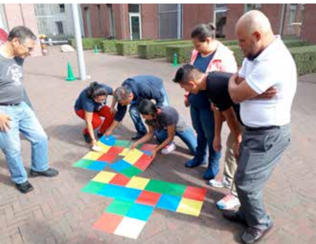
een moeilijke oefening bij een workshop