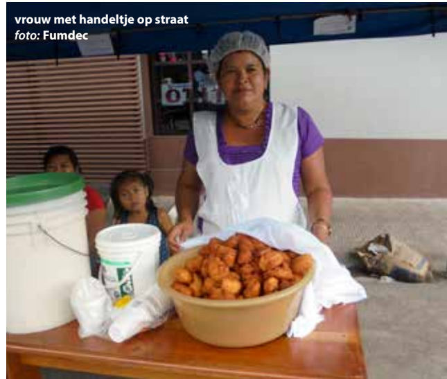
vrouw met handeltje op straat