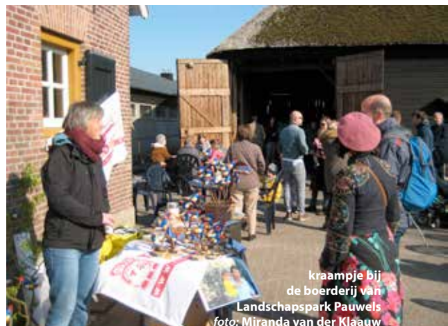
kraampje bij de boerderij van Landschapspark Pauwels