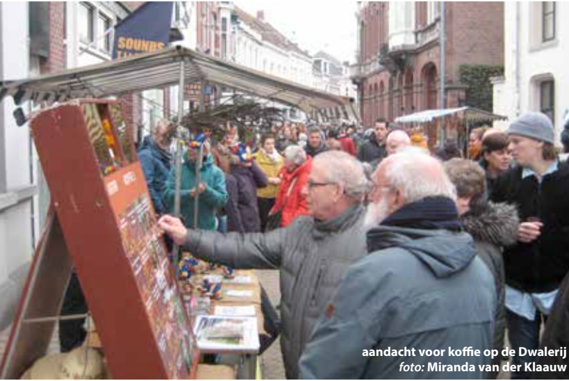
aandacht voor koffie op de Dwalerij