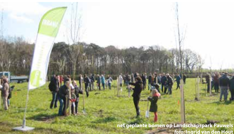
net geplante bomen op Landschapspark Pauwels

In Tilburg waren wij aanwezig bij het planten van Geboortebomen op Landschapspark Pauwels, aan de noordelijke rand van Tilburg. Dit project is het vervolg van het Geboortebos in het Noorderbos, dat is gekoppeld aan het Geboortebos in Matagalpa.