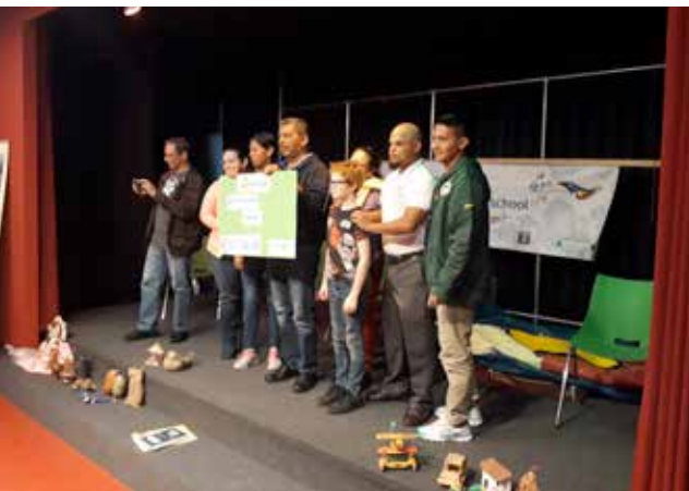
docenten Matagalpa op bezoek bij school Jeanne d'Arc