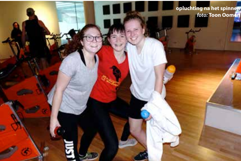
opluchting na het spinnen