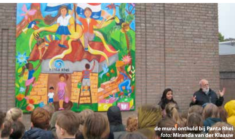
de mural onthuld bij Panta Rhei