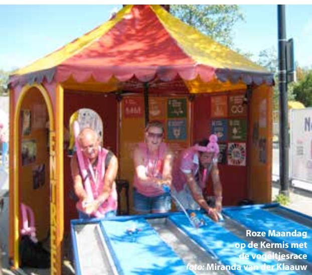
Roze Maandag op de Kermis met de vogeltjesrace

Tot slot: wij vierden dit jaar ons 35-jarig bestaan met een symposium, maaltijd en feestavond. Zo'n 80 bezoekers vierden dit met ons mee en samen maakten we er een mooie dag van.