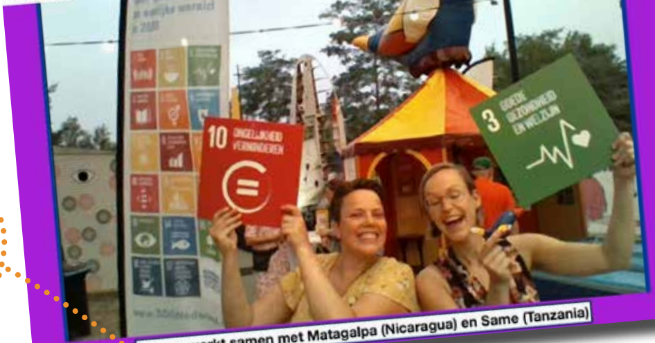
Tilburg werkt samen met Matagalpa (Nicaragua) en Same (Tanzania)