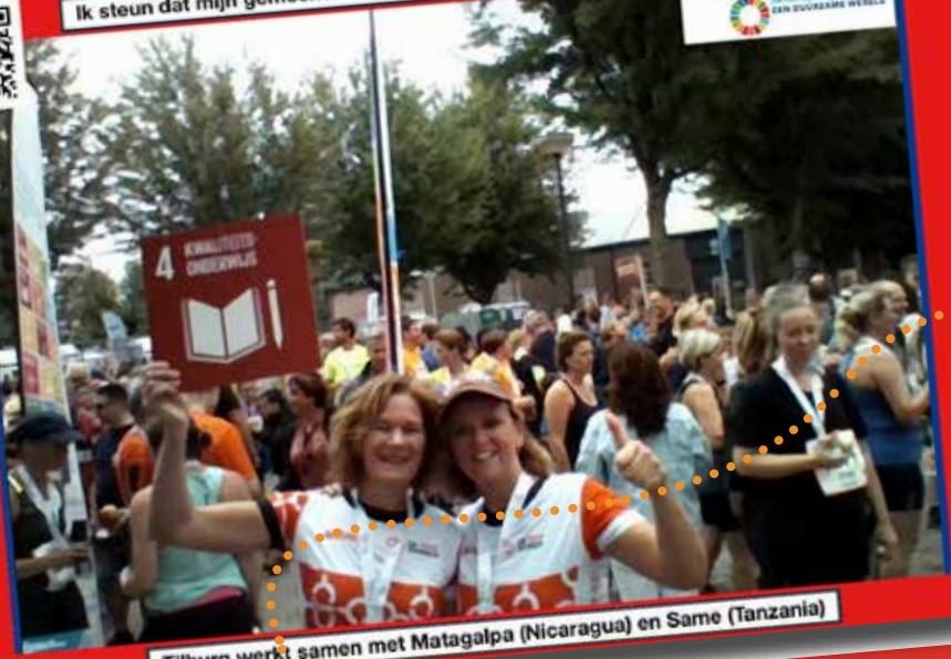
Tilburg werkt samen met Matagalpa (Nicaragua) en Same (Tanzania)